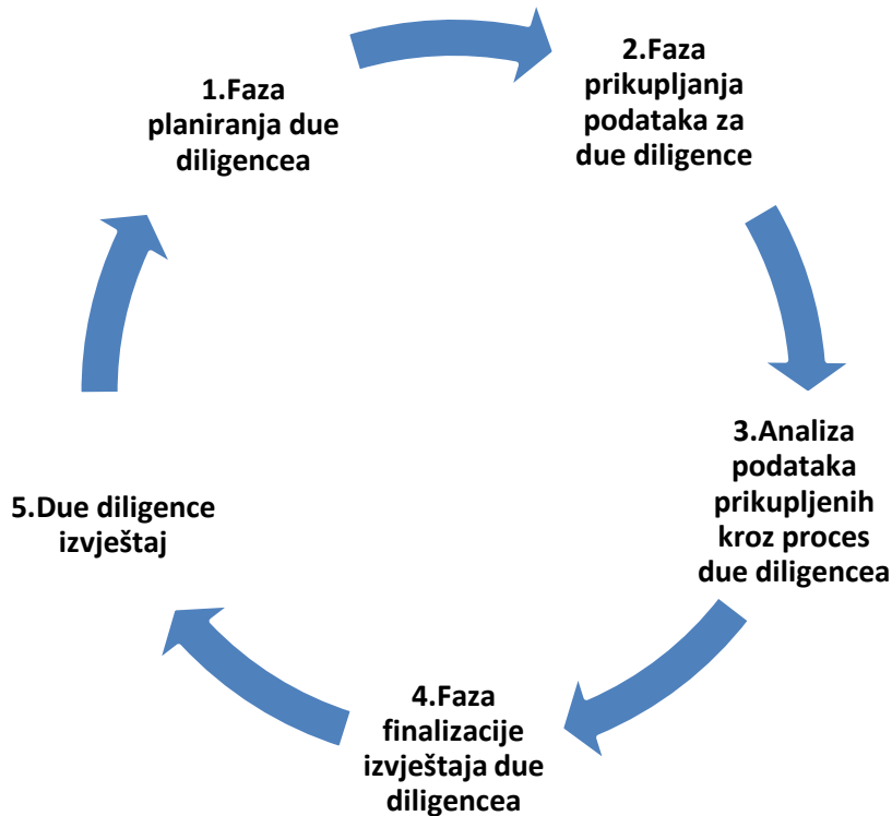
Slika 2: Faze u postupku due diligence