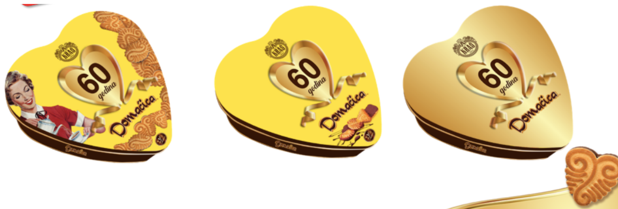
Slika 24. Limena retro ambalaža Domaćica keksa