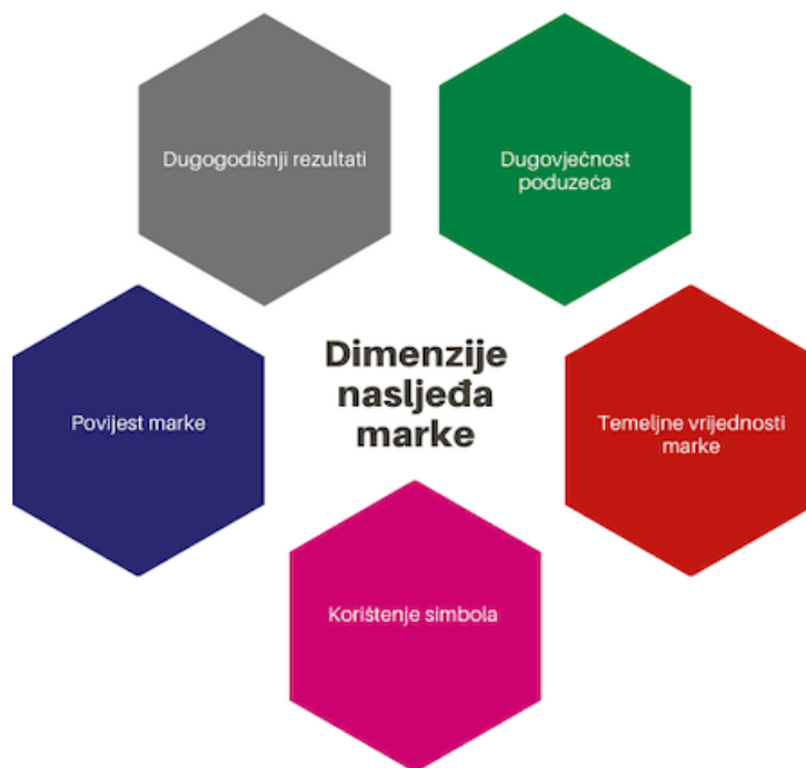
Slika 1. Dimenzije nasljeđa marke