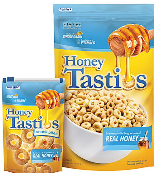
Slika 5. Ambalaža Honey Tastios pahuljica