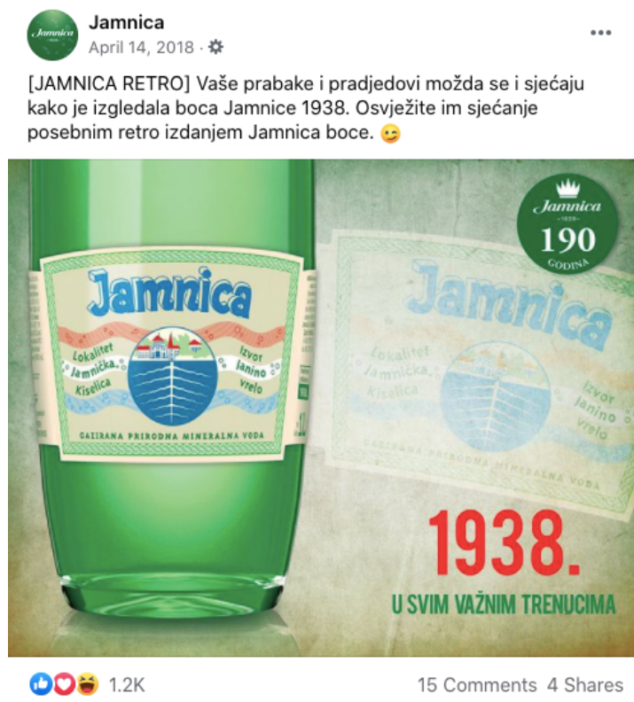
Slika 17. Objava retro etikete iz 1938. godine