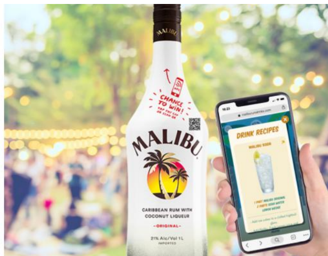
Slika 7. Malibu Rum pametna ambalaža