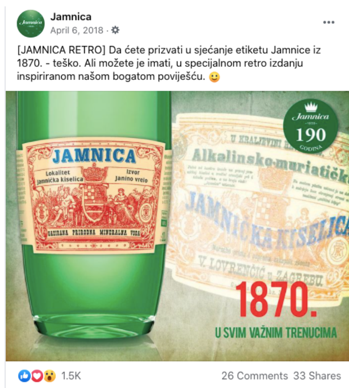
Slika 14. Objava retro etiketa iz 1870. godine