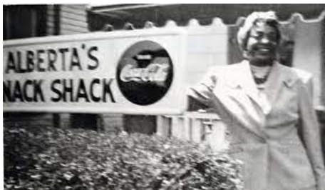
Slika 5. Albertin hotel u Springfieldu