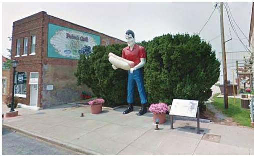
Slika 7. Statua Paula Bunyana u Atlanti