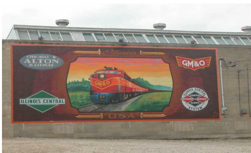
Slika 8. Ručno izrađen vagon u Lincolnu