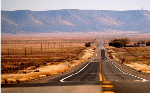
Slika 2. Izgled Route 66