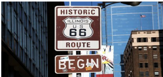
Slika 10. Povijesni znak početka rute 66