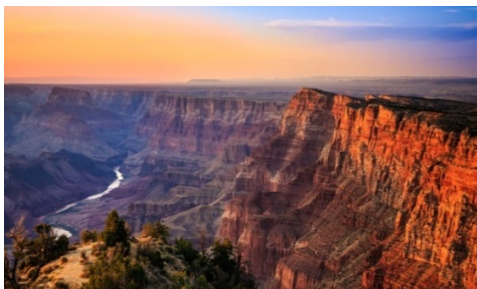
Slika 12. Nacionalni park Grand Canyon