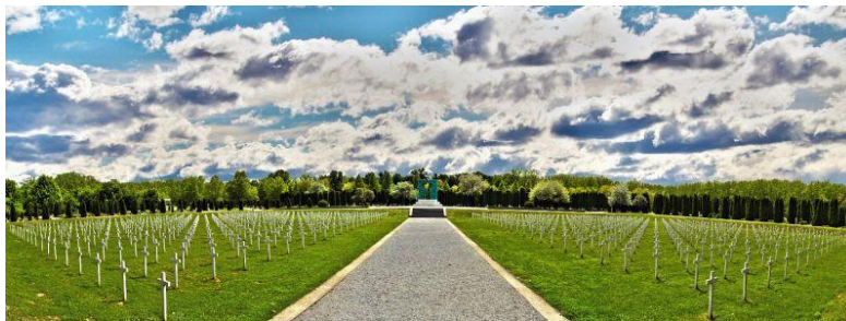
Slika 3: Memorijalno groblje žrtava iz Domovinskog rata