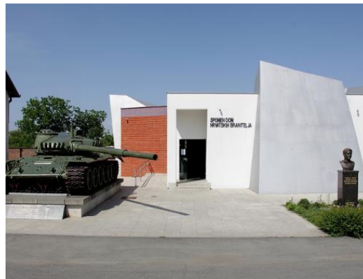
Slika 5: Spomen dom hrvatskih branitelja u Borovu naselju