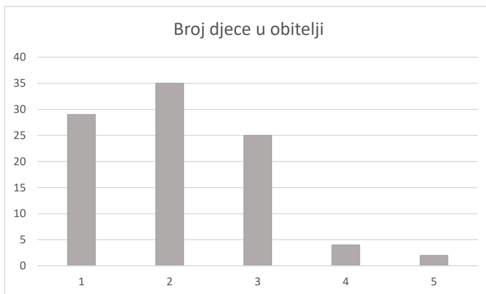
Grafikon 1: Prikaz broja djece u obitelji

Istraživanjem su obuhvaćeni roditelji raznih stupnjeva školske spreme: osnovno obrazovanje (N=2), strukovno obrazovanje (N=2), trogodišnje strukovno obrazovanje (N=22), gimnazijsko srednjoškolsko ili četverogodišnje i petogodišnje strukovno srednjoškolsko obrazovanje