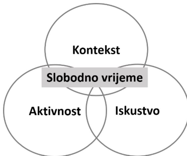
Slika 1. LACE model (Caldwell, 2011)

Jedan od načina razumijevanja razvoja mladih kroz slobodno vrijeme je iz perspektive „djelovanja u kontekstu“ (Silbereisen, i sur., 1986). Kroz perspektivu djelovanja u kontekstu nastoje se objasniti razlozi koji stoje iza izbora mladih, usredotočujući se na interakciju između aktivnosti u slobodno vrijeme, kontekst odvijanja aktivnosti i stečenih iskustva kroz sudjelovanje u slobodnim aktivnostima (Caldwell, 2011; Caldwell i Faulk, 2013). Model koji uzima u obzir aktivnosti, kontekst i kvalitetu doživljenih iskustva u slobodno vrijeme je LACE Model - Model slobodnih aktivnosti-konteksta-iskustva (eng. model Leisure Activity-Context-Experience ) (Caldwell, 2005; Caldwell, 2011) (vidi sliku 1). Upravo ovaj model pruža okvir za razumijevanje razvoja mladih u kontekstu slobodnog vremena (Belošević i Ferić, 2022a; Caldwell, 2005; Caldwell, 2011). LACE model pretpostavlja kako su slobodne aktivnosti, kontekst i iskustvo sudjelovanja u slobodnim aktivnostima međusobno povezani te da oni „u kombinaciji stvaraju uvjete koji ili služe za zaštitu mladih od negativnih ili rizičnih ponašanja ili promiču njihov pozitivan i zdrav razvoj“ (Caldwell i Faulk, 2013, str. 50).