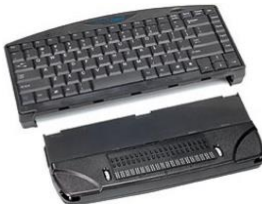
Slika 3. Univerzalna Brailleova tipkovnica

Ovaj proizvod je na bazi računalnog programa, koji se implementira u operativni sustav korisnika, te se automatski pokreće i omogućava korištenje računalne tastature kao Brailleovog pisačkog stroja u bilo kojoj aplikaciji. Korisnik u svakom trenutku može koristiti standardnu tipkovnicu, ili svoju tipkovnicu pretvoriti u Brailleov pisači stroj, te na njoj pisati kao na mehaničkom Brailleovom pisačem stroju koristeći šestotačkasto, ili osmotačkasto Brailleovo pismo (Hrvatski savez slijepih).