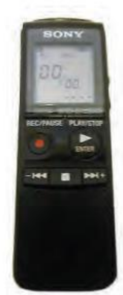
Slika 10. Digitalni snimači ili diktafoni za osobe oštećena vida

Jedan od takvih je Sony PX720 uređaj za snimanje i reproduciranje zvuka raspolaže memorijom od 64 Mb što je dovoljno za 7 sati neprekidnog snimanja odličnog kvaliteta. Može se povezati sa računarom USB priključka. Softver za prebacivanje snimaka i podešavanje postavki diktafona je kompatibilan s čitačima ekrana kao što je primjerice JAW for Windows koji je već navođen (Lazor, 2017).