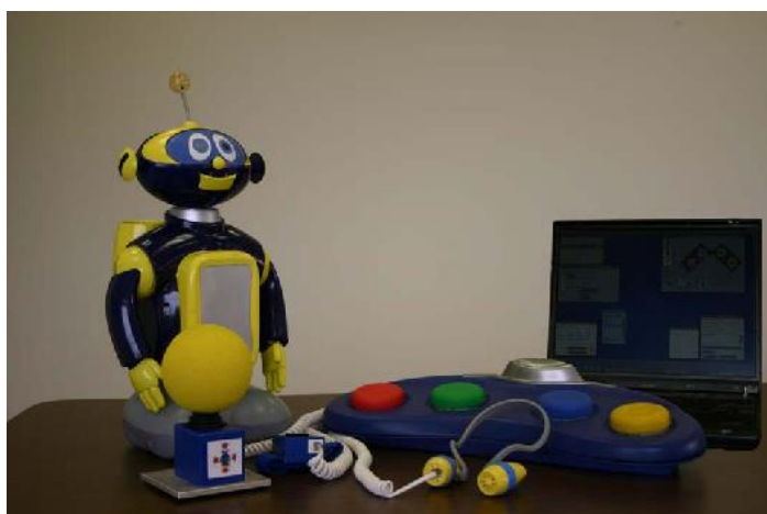
Slika 4. CosmoBot robotski uređaj