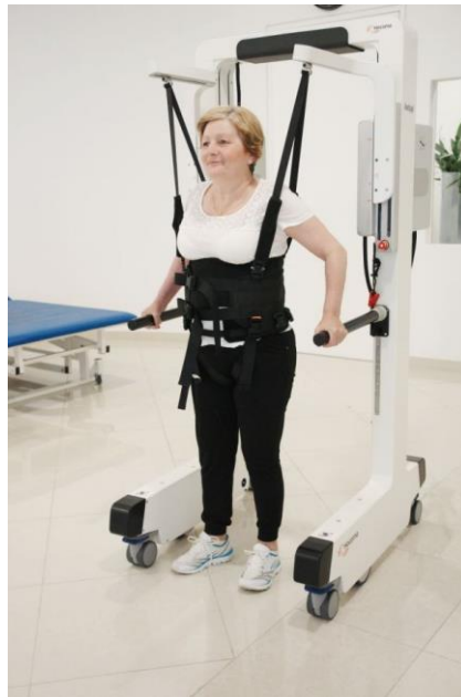
Slika 11. Robotski uređaj Andago

robotskih uređaja namijenjenih za trening hoda. Nadalje, ovaj robotski uređaj prilagođava svoju brzinu osobi koja može ubrzati, usporiti, zaustaviti se, okrenuti i hodati unatrag u bilo kojem trenutku tijekom trajanja terapije. Sustav je ograničen na maksimalnu brzinu od 3,2 km/h te ima tri različita načina upravljanja. Kod prvog načina upravljanja uređaj prati pokrete osobe u bilo kojem smjeru. Drugi način upravljanja ograničava hod osobe na ravnu liniju (kretanje unaprijed ili unazad). U trećem načinu upravljanja senzori su deaktivirani i sustav ne prati pokrete osobe već uređajem upravlja terapeut pomoću daljinskog upravljača (van Hedel i sur., 2021). Andago robotski uređaj osobama omogućava intenzivan trening funkcionalnih zadataka mobilnosti i ravnoteže koji uključuju okretanje, zaustavljanje, pokretanje te izbjegavanje prepreka koje ispred osobe postavlja terapeut i koje odgovaraju unutarnjoj širini robotskog uređaja. Ovi zadaci pripremaju osobu za sudjelovanje u aktivnostima svakodnevnog života bez straha od mogućnosti pada, smanjuju nesigurnost osobe te potiču samoinicijativu u aktivnostima povezanim s kretanjem (van Hedel i sur., 2021).