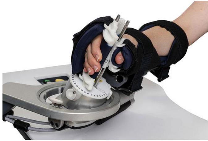
Slika 9. InMotion2 robotski uređaj