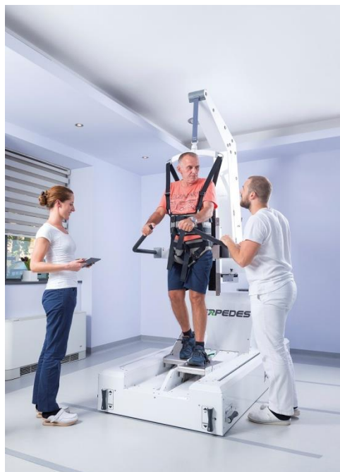
Slika 14. PerPedes robotski uređaj