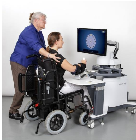
Slika 8. InMotion2 robotski uređaj

sliku te željene ishode neurorehabilitacijskog procesa, a uključuju povećanje samostalnosti prilikom izvođenja svakodnevnih aktivnosti, povećanje raspona pokreta, brzine i snage izvođenja pokreta te poboljšanje motoričkog planiranja, koordinacije oko ruka, snage, pažnje i koncentracije (Bayon i sur., 2016). InMotion2 robotski uređaj programiran je na način da prati izvedbu osobe prilikom obavljanja određene aktivnosti te da pruža fizičku podršku u onoj mjeri u kojoj je to potrebno kako bi osoba uspješno dovršila zadatak. Potreba za pružanjem odgovarajuće razine podrške određuje se na temelju podataka dobivenih tijekom korištenja uređaja, a uključuju podatke o brzini izvođenja pokreta te vremena potrebnog za dovršavanje zadatka (Ibrahim i sur., 2022). Ukoliko osoba ne može samostalno izvesti zadatak, robotski uređaj pruža potporu pri njegovom rješavanju. S druge strane, InMotion2 robotski uređaj pruža motivaciju i izazov te potiče osobu na izvođenje specifičnog pokreta ovisno o njegovim motoričkim sposobnostima (Duret i sur., 2015). Tijekom cijelog trajanja terapije, ovaj sustav zadaje specifične aktivnosti, nadzire pokrete osobe te pruža podršku kako bi uspješnost obavljanja zadataka i dostizanja ciljeva bila što veća.