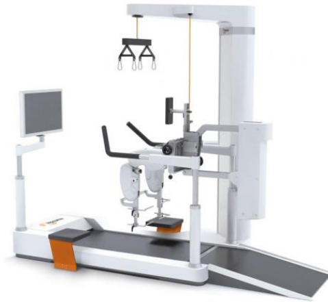
Slika 10. Robotski uređaj Lokomat

djece s cerebralnom paralizom. Također, pozitivni učinci primjene Lokomata vidljivi su u poboljšanju motoričkih sposobnosti donjih ekstremiteta što vodi ka učestalijoj fizičkoj aktivnosti (Nam i sur., 2017).