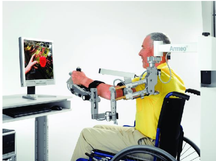
Slika 1. Prikaz Armeo Spring robotskog uređaja

i sur., 2018). Povećanjem samostalnosti pokreta ruke prilikom izvođenja zadataka povećava se i samopouzdanje osobe pa ona aktivno sudjeluje u obavljanju svakodnevnih aktivnosti smanjujući na taj način ovisnost o osobama iz okoline.