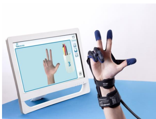
Slika 6. GloReha robotska rukavica