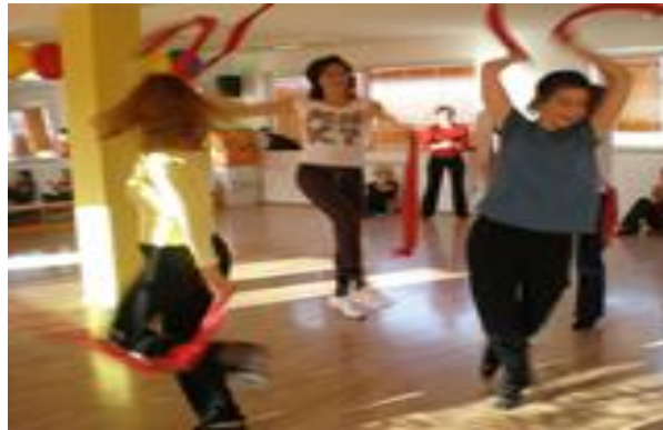
Slika 12. Prikaz improvizacije uz pomoć pribora ( http://www.plesnicentروسميه.com/edukativni_seminari.html )

materijali (slika 12) kao maske, baloni, bubnjevi i itd . Glavni fokus kod improvizacije jest razvoj kreativnost, samopoštovanje, pravo na izbor i razvoj osobnog stila. Kao što je navedeno, ono nije usmjereno prema terapijskom učinku, ali može biti.