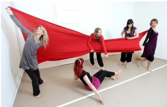
Slika 4. Primjena rekvizita u terapiji

Ilustracija pojedinih tehnika prikazana je na slikama ( 4, 5, 6):