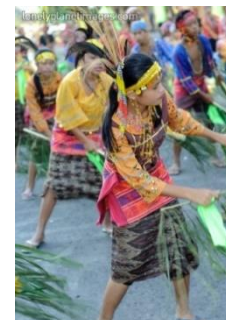
Slika 3. Prikaz plesne ceremonije