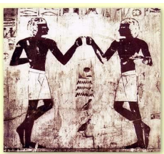
Slika 1. Prikaz plesne figure u Egiptu

Obredna i simbolička primjena plesa korištena je već u prapočetku ljudske civilizacije, tijekom različitih povijesnih razdoblja, pa sve do današnjih dana u okviru vjerskih, iscjeliteljskih i socijalnih ceremonija (slika 1, 2, 3). Arheološki nalazi tragova plesa prisutni su na zidnim freskama od prapovijesnog vremena kao npr. kod 9,000 godina stare Bhimbetske špilje u Indiji i Egipatskog groba, gdje je na slici prikazana plesna figura od 3300. godina prije Krista. Jordania (2011) smatra da je ples, zajedno s ritmom glazbe i oslikavanjem tijela nastao kao snaga prirodne selekcije u ranoj fazi hominoidne evolucije kao potencijalni alat za grupiranje ljudskih predaka u borbenom zanosu i transu. S druge strane, ples je bio upotrebljen kao dio obrednog ili ritualnog liječenja, i još uvijek se koristi u tu svrhu u nekim kulturama iz brazilske prašume do Kalahari pustinje (Guenther, 1975). Ples je također odigrao važnu ulogu u prošlosti davajući ratniku moralnu podršku (Pieslak, 2009), također u pričanju mitova, te je utjecao na odnos između ljudi ili bogova (Comte, 2004).