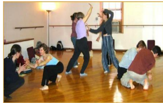
Slika 5. Mirroring