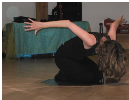
Slika 6. Izvorni pokret

Kao jedna od srodnih formi koja se može koristiti uz terapiju pokretom i plesom je kontakt improvizacija u kojoj je kontakt između plesača polazišna točka koja vodi prema stvaranju jedinstvenog improviziranog pokreta i/ili plesa (Lemieux, 1988). Improvizirani pokret se razvija na osnovi unutarnje svijesti o vlastitom tijelu, te svijesti o odnosu kretanja s