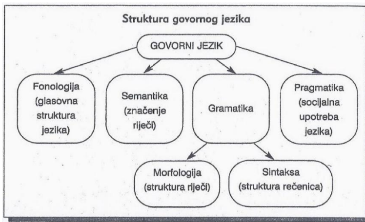
Slika 1: Struktura govornog jezika (Likierman i Muter, 2007)