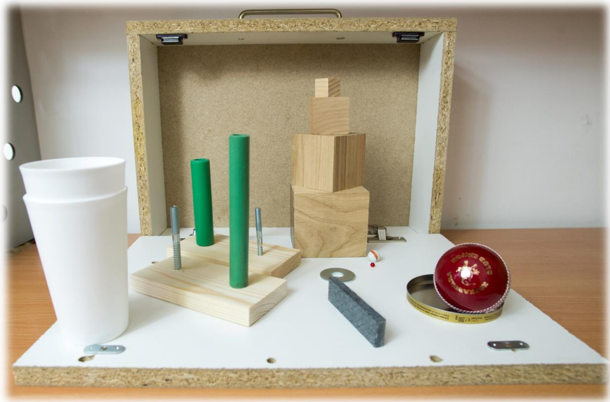
Slika 3 Action Research Arm Test

ARAT je vrlo osjetljiv i precizan mjerni instrument za diferencijaciju osoba s blagim do umjerenim motoričkim oštećenjima gornjih ekstremiteta nakon moždanog udara (Chen i sur., 2012). Nordin i sur. (2014) ističu kako je ARAT pouzdan mjerni instrument za opservaciju funkcije ruke i šake kod osoba koje su doživjele moždani udar. Nadalje, ovaj instrument je koristan za procjenu motoričke funkcije gornjih ekstremiteta kod osoba tijekom oporavka ili nakon liječenja (Chen i sur., 2012).