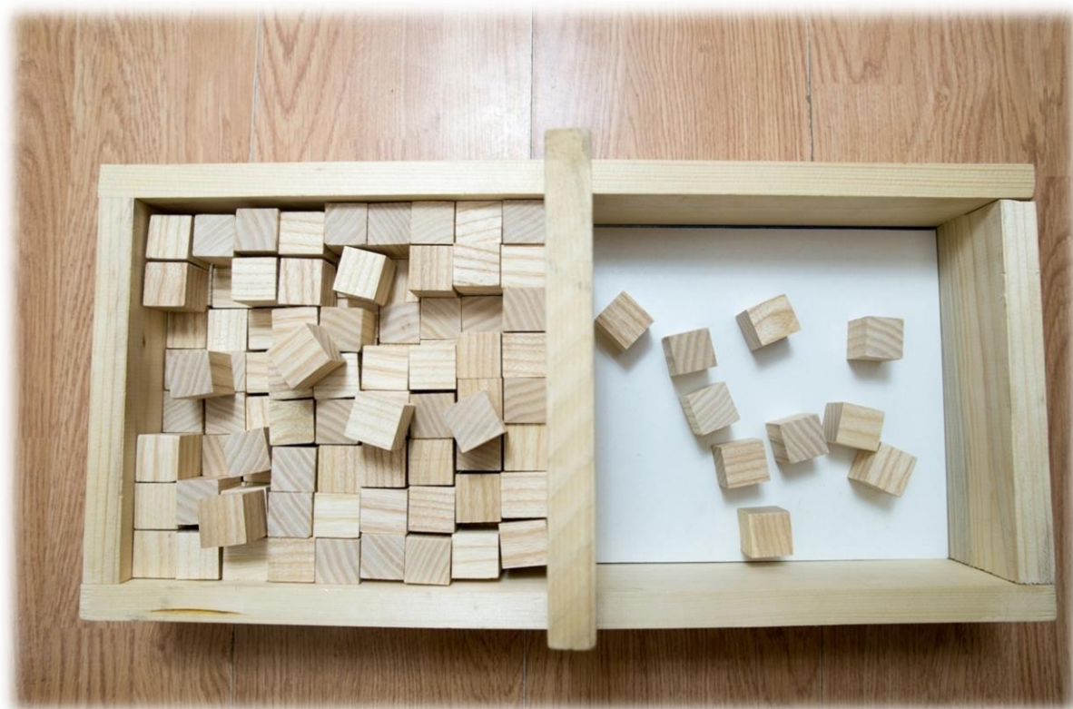
Slika 1 Box and Block Test