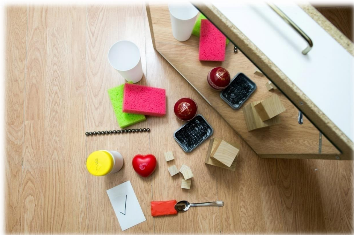
Slika 4 Zrcalo i rekviziti za vježbe