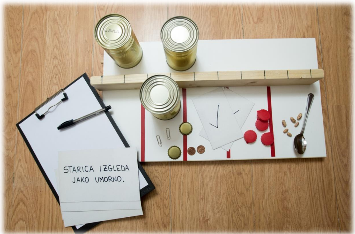
Slika 2 Jebsen Hand Function Test

Bodovanje se vrši tako da se bilježe sekunde potrebne za dovršavanje svakog od sedam zadataka. Duže vrijeme potrebno za dovršavanje svih zadataka upućuje na sniženu funkcionalnost ili onesposobljenost ruke koja se procjenjuje (Hackel i sur., 1992). Maksimalno vrijeme dozvoljeno za svaki subtest iznosi 120 sekundi (Duncan i sur., 1998, prema Beebe i Lang, 2009). Za provođenje testa je potrebno 10-15 minuta (Poole, 2011, prema Carr i sur., 2015), a sastoji se od jednostavnih, jeftinih i lako dostupnih materijala (Hackel i sur., 1992). To je pouzdan instrument za praćenje promjena u motoričkoj funkciji ruku tijekom liječenja (Carr i sur., 2015).