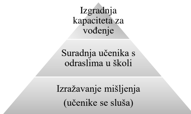
Slika 2. Piramida glasa učenika (Mitra, 2005)

Govoreći o participaciji djece u škole, važnoj je napomenuti kako se često govori i razmatra o participaciji kao „glasu učenika“. Mitra (2005) nudi najpoznatiji model glasa učenika, tzv. piramidu glasa učenika: