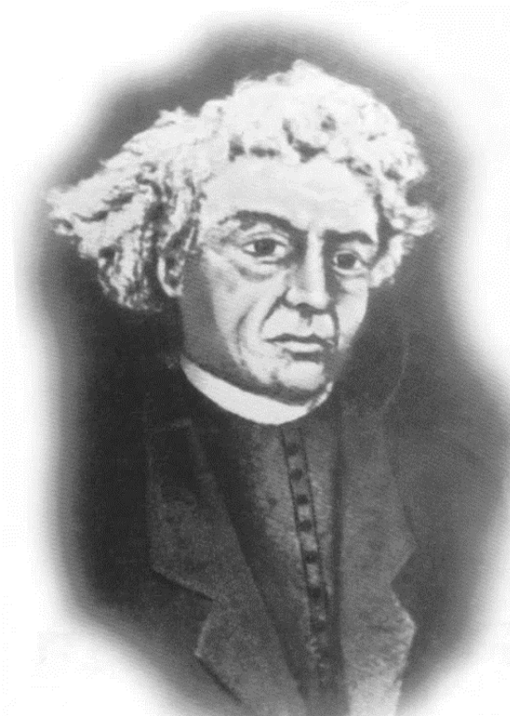
Slika 1. Portret Tomaša Mikloušića

Svećenik i književnik Tomaš Mikloušić rođen je 24. listopada 1767. u Jastrebarskom od oca Josipa i majke Katarine Antonije (Jembrih 2012: 11). U Zagrebu je pohađao gornjogradsku Arhigimnaziju, a zatim i studij filozofije na zagrebačkoj akademiji (Cesarec 2008: 50). Od 1787. do 1790. studira teologiju u Pešti, a potom se vraća u Zagreb gdje radi kao vjeroučitelj na pučkim školama. U Zagrebu je 1791. godine zaređen za svećenika, nakon čega službuje kao kapelan u župi Pleševica pod Okićem. Od 1795. radi kao profesor gramatike na zagrebačkoj Arhigimnaziji, a od 1799. kao profesor poetike. Godine 1805., nakon desetljeća rada u školi, službuje kao župnik u župi Pušča, a potom i u Stenjevcu gdje ostaje punih dvadeset i šest godina, sve do 1831. Od 1831., vjerojatno po vlastitoj želji, službuje u župi sv. Nikole u rodnome Jastrebarskom gdje i umire 7. siječnja 1833. godine (Jembrih 2012: 12). Danas se više ne zna gdje mu je grob, a dvije ulice, jedna u rodnome Jastrebarskom, a druga u Zagrebu, nose njegovo ime (usp. Cesarec 2008: bilj. 53).