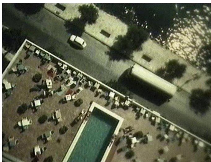
22. Sunčani Jadran

Ponekad se humor ostvaruje u iznimno kreativnoj međuigri između slike i govora. Niz takvih primjera uočili smo opisujući naratorovu upotrebu stilskih figura, a spomenimo još neke. U autoreferencijalnom primjeru u filmu Mala čuda velike prirode 1 , da bi duhovito opisao brzinu i neuhvatljivost ptice vodenkos, narator je nekoliko puta počne opisivati riječima „Ta ptica...“, ali svaki put zastane, jer vodenkos šmugne iz kadra. Duhoviti metafilmski primjer međuigre slike i govora jest naratorovo referiranje na povijest filma u kozerijskom filmu Sunčani Jadran . Naime, opisujući jadranske hotele, narator uz slikovni prikaz jednog hotela klasičnog arhitektonskog izgleda kaže: „Ovako se sviđalo Habsburgovcima“, da bi nakon toga napravio izrazitu digresiju, tipičnu za stilsku slobodu kozerijskih filmova, i uz kadar snimljen iz oštre ptičje perspektive s vrha visokog hotela Marjan u Splitu izrekao: „A ovo bi se sviđjelo Hitchcocku“, referirajući se time na poznate kadrove iz oštre ptičje perspektive u Hitchcockovim filmovima Sjever-sjeverozapad ( North by Northwest , 1959, SAD) i Vrtoglavica ( Vertigo , 1958, SAD) (fotografija 22).