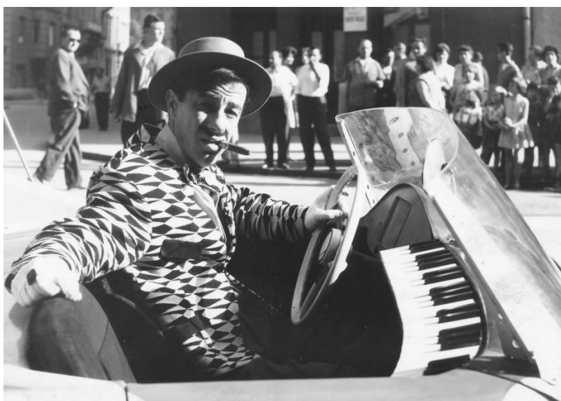
14. Dolje pješaci

maštovit i blag način ismijava se mana ljudske taštine. Dok glavni lik, što je posljedica njegove taštine, leži teško ozlijeđen pod prevrnutim autom, čak i tada izgleda komično. Na kraju filma ozlijeđena ga voze u njegovu novom prijevoznom sredstvu – tačkama, simbolu krajnje degradacije njegove tašte želje. Humor u filmu je veseo, ali nije samo „hedonistički užitek u čistoj zabavi“ jer nas uz njegovu pomoć autori upozoravaju što se može dogoditi vozačima koji se prepuste težnjama svoje taštine. Veselo komično u filmu izgledaju i stilizirani prizori gomile policajaca koji zvižde jurećem automobilu i hrpe prometnih znakova koji se sklanjaju pred automobilom, ali njihova pedagoška funkcija je jasna.