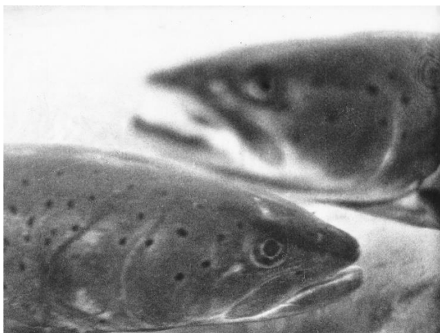
1. Priča o glavatici