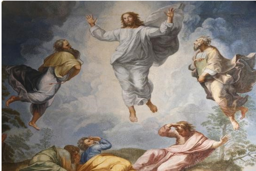
Slika 8. Uskrsnuće Kristovo, autor: Raffaello Santi da Urbino

„Uskrsni se sklop običaja može analizirati kao obred prijelaza (usp. Čapo Žmegač 1993). U mnogim religijskim vjerovanjima prisutna je ideja da umiranje na ovom svijetu znači život odnosno rođenje na drugome svijetu. U kršćanstvu to potvrđuju smrt i uskrsnuće Isusa Krista. Kako je rekao hrvatski teolog Bonaventura Duda, Uskrs je pobjeda života nad smrću, a vjera u Isusovo rođenje ujedno je i nada u uskrsnuće svih ljudi (Duda 1992). U Uskrsu se, dakle, sjećanjem na Isusovo uskrsnuće, slavi obećanje novog života ljudi na drugom svijetu. Stoga uskrsni običaji sadrže obrede prijelaza kojima se korizmenom pripravom napušta staro stanje – stanje života uskrsnoga i poslijeuskrsnoga razdoblja u kojemu je Otkupiteljevom smrću na križu ljudima obećano ponovo rođenje“ (Čapo Žmegač 1997:20).