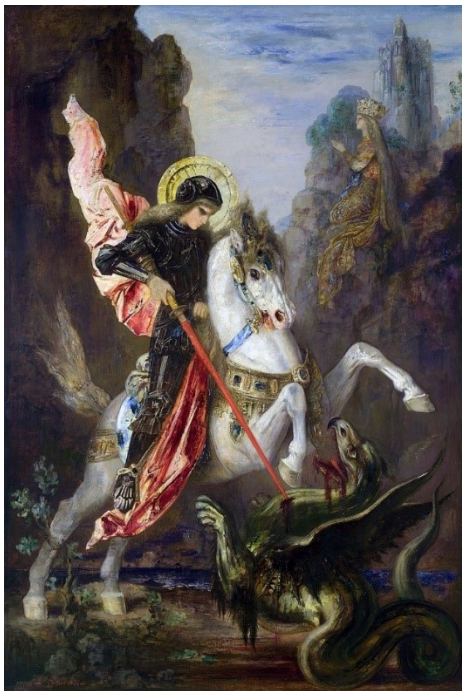
Slika 2. Sv. Juraj i zmaj, autor: Gustave Moreau

Brak se sklapa na Ivanje, trenutak u kojem Juraj postaje u narodnoj predaji Ivan kojeg ubijaju zbog bračne nevjere, a ljupka Mara postaje okrutna Morana koja umire pred kraj godine, kada priča ciklički počinje ispočetka. Dolaskom pred zlatna vrata Perunova dvora na Zemlji, prije nego će Juraj zaprositi Maru, predaje joj ključeve Velesovog mitskog svijeta Vireja „... kako bi se spajanjem dvaju principa – vlažnosti podzemlja i sunca gornjeg svijeta – dobio temelj plodnosti “ (Vukelić 2012:16).