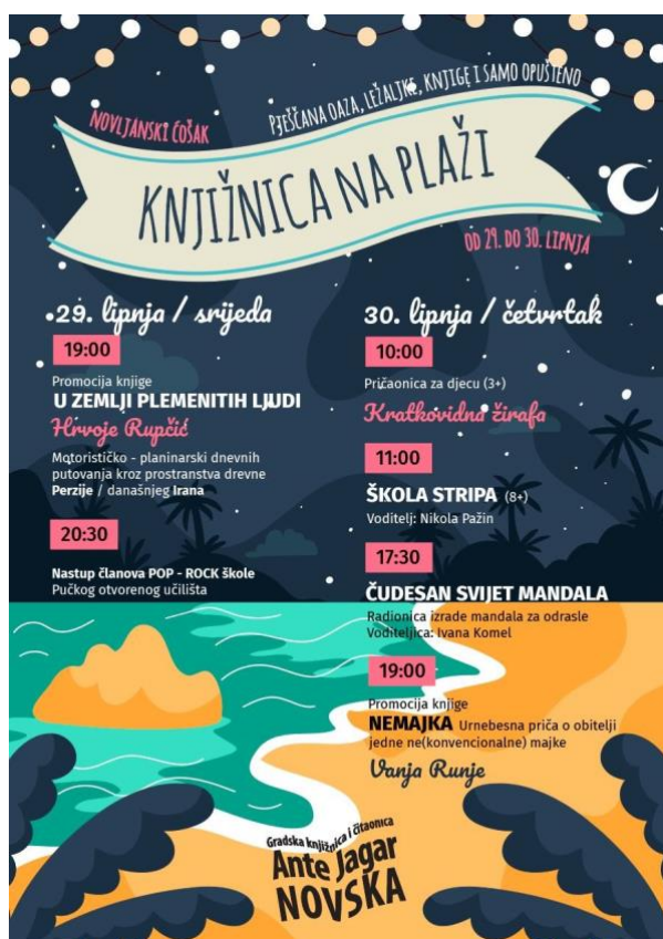
Sl.6. Program „Knjižnica na plaži“ 2022. godine

Kao što se može uočiti, program „Knjižnica na plaži“ bogat je raznovrsnim sadržajima i aktivnostima za sve korisnike (i one koji će to tek postati) bez obzira na dob. Cilj programa je organiziranje zajedničkih aktivnosti u kojima djeca i odrasli stječu osjećaj pripadnosti zajednici u kojoj žive te obogaćivanje kulturnog programa Grada Novske. 50 Prepoznatljivost i vidljivost knjižnice i njezinih usluga može se očitovati kroz razne usluge koje ona nudi svima. Zato je od iznimne važnosti da se što veći broj građana uključujući u sudjelovanje u ovakav vid programa.