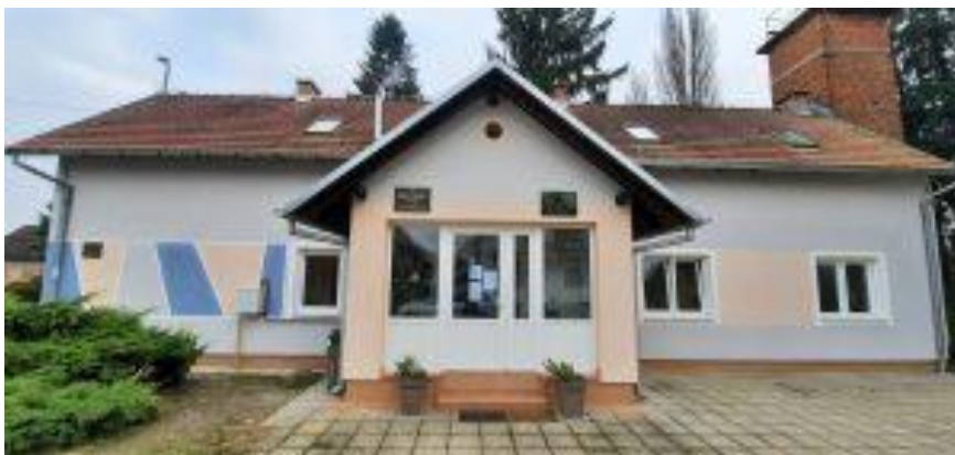
Sl.5. Narodna knjižnica i čitaonica Jasenovac

Sisačko-moslavačke županije i Ministarstva kulture, sve u svrhu širenja interesnih skupina korisnika.