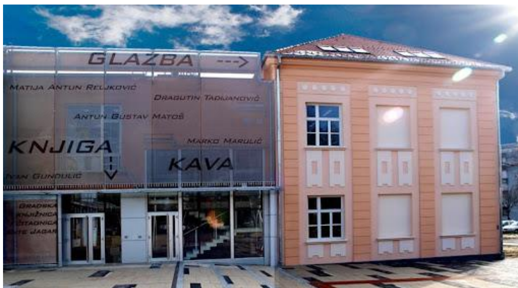
Sl.1 Lijevo je Gradska knjižnica i čitaonica „Ante Jagar“ Novska, a desno Glazbena škola u Novskoj 29

Djelatnost čitaonice u Novskoj baštini se još od 1876. godine. Tada se prvi puta spominje u „Izvešću Matice hrvatske“ za tu godinu. Prva samostalna knjižnica i čitaonica u Novskoj osnovana je 1951. godine pod nazivom „Narodna knjižnica i čitaonica Novska“. Osnivanjem „Radničkog sveučilišta“ 1960. godine, knjižnična i čitaonička djelatnost u Novskoj više se ne obavlja u samostalnoj knjižnici i čitaonici, već djeluje u sastavu Sveučilišta koje 1963. godine postaje „Narodno sveučilište Novska“. Odlukom Gradskog vijeća Grada Novske od 4. listopada 1996. godine osnovana je Gradska knjižnica i čitaonica „Ante Jagar“ Novska kao samostalna ustanova. Ime je dobila po marijanskom pjesniku Anti Jagaru rođenom i umrlom u Novskoj (1867. – 1899.). Dugi niz godina Gradska knjižnica djelovala je u prostoru u Ulici kralja Tomislava od svega 200m 2 . Bilo je nužno pronaći veći i komotniji prostor kako bi knjižnica mogla biti prostranija i ugodnija za svoje korisnike. Putem Europske investicijske banke Vlada Republike Hrvatske i Grad Novska sufinancirali su projekt izgradnje nove zgrade gradske knjižnice naslonjene uz obnovljenu staru srednju školu za potrebe Glazbene škole u Novskoj. 29. siječnja 2010. godine predsjednica Vlade RH gospođa Jadranka Kosor otvorila je novi prostor knjižnice koji se proteže kroz 989m 2 i predstavlja jednu od najmodernijih gradskih knjižnica u Hrvatskoj. 28 U nastavku donosim fotografije Gradske knjižnice u Novskoj.