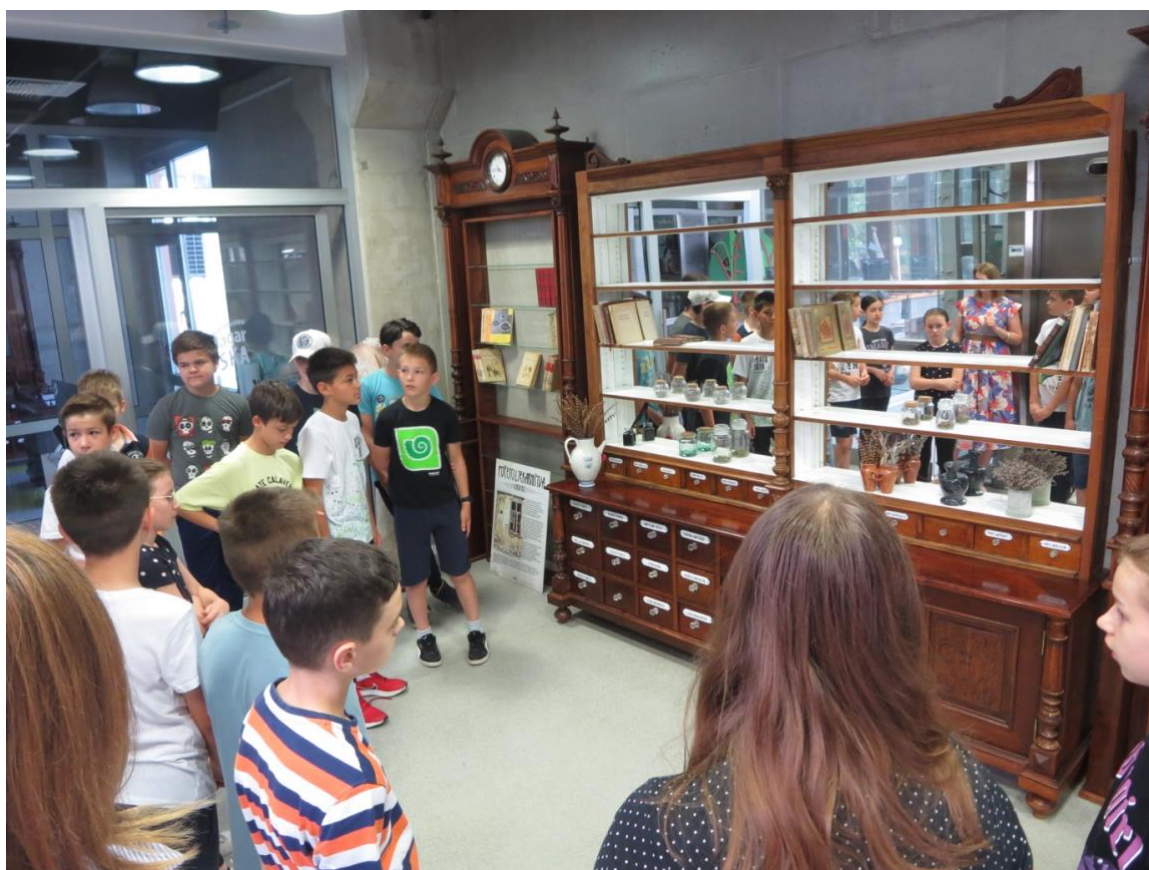
Sl.2. Učenici Katoličke osnovne škole u posjeti Gradskoj knjižnici i čitaonici „Ante Jagar“ Novska u kojoj je smješten namještaj ljekarne „Sveta Marija“