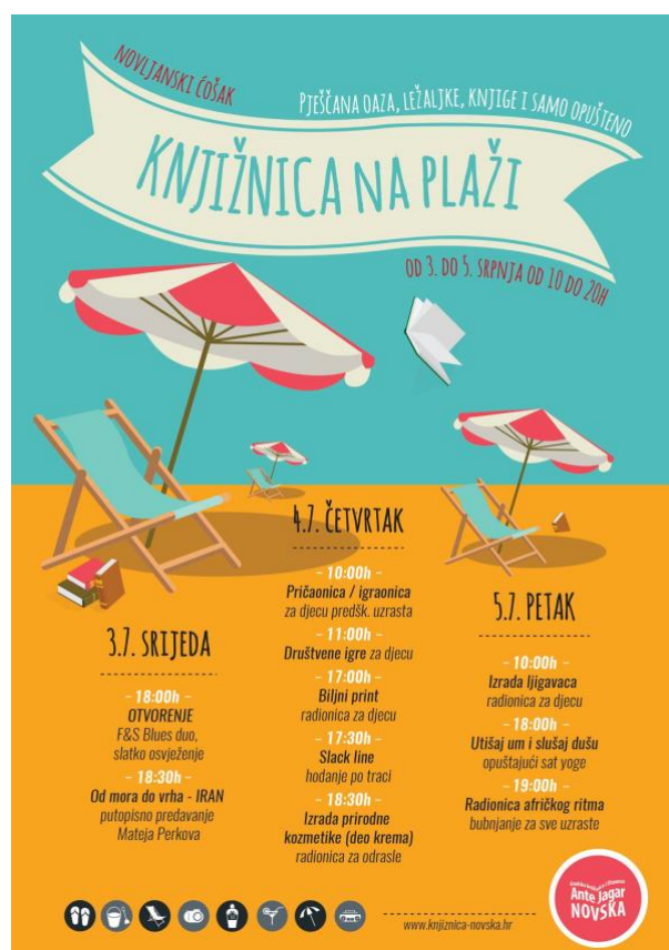
Sl.7. Program „Knjižnica na plaži“ 2019. godine