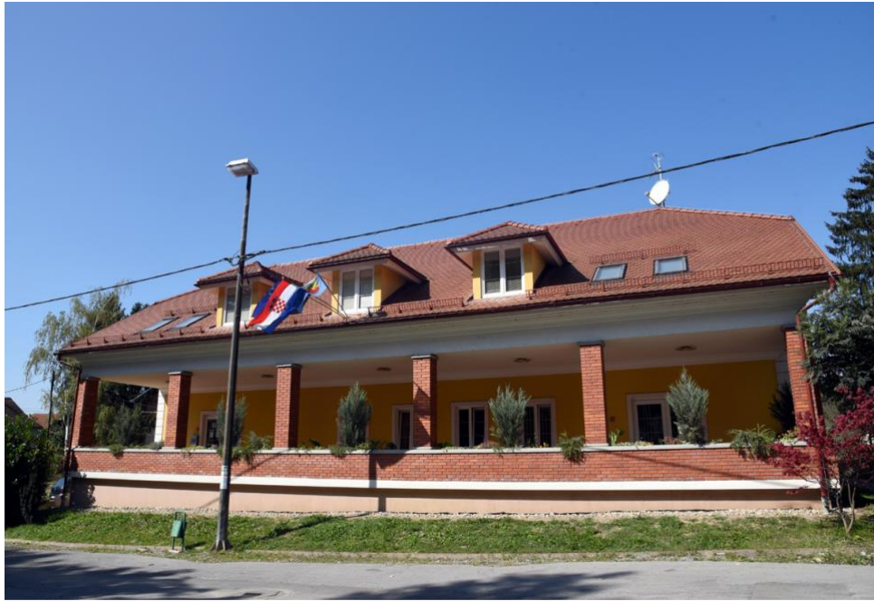
Sl.4. Narodna knjižnica i čitaonica Lipovljani