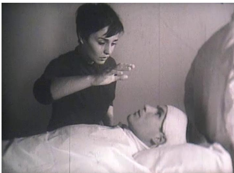
4. Čuvaj se čašice

Specifičan su primjer filmovi o prometu Nikše Fulgosija. On je 1962. i 1963. godine napravio deset kozerijskih odgojnih filmova o prometnim pravilima i u njima redovito upotrebljavao fabulu i igranofilmska stilska sredstva. Fikcija je posebice prisutna u kasnijim filmovima iz 1963., a njihova razvijena fabula, stil i ikonografija podsjećaju na konvencije tada popularnih igranofilmskih žanrova melodrame, trilera i tinejdžerskog filma. Tako film Čuvaj se čašice koristi konvencije melodrame razvijajući priču o vozaču kamiona koji se za vrijeme pauze napije, nakon toga brzo vozi i izazove prometnu nesreću u kojoj njegov suvozač teško strada, nakon čega se vozač mora suočiti s obitelji unesrećenoga kolege. Scena filma u kojoj se vozač suočava sa stradalim suvozačem, njegovom suprugom i kćeri emocionalno je iznimno dramatična, puna melodramatskih motiva (supruga se razveseli kad vidi svog supruga na nosilima, ali shvati da je u komi i zaplače; uplakanoj suvozačevoj kćeri ispadne plišani medvjedić iz ruke) i melodramatskih stilskih konvencija (režijske retardacije kojima se pažnja usmjerava na emocionalne reakcije umjesto na postupke likova, krupni planovi emocionalnih reakcija likova, vožnja kamere koja otkriva dramatičnu situaciju, dramatična glazbena podloga) (fotografija 4). Melodramatičnosti filma doprinosi i emocijama nabijeno naratorovo pripovijedanje i komentiranje prizora.