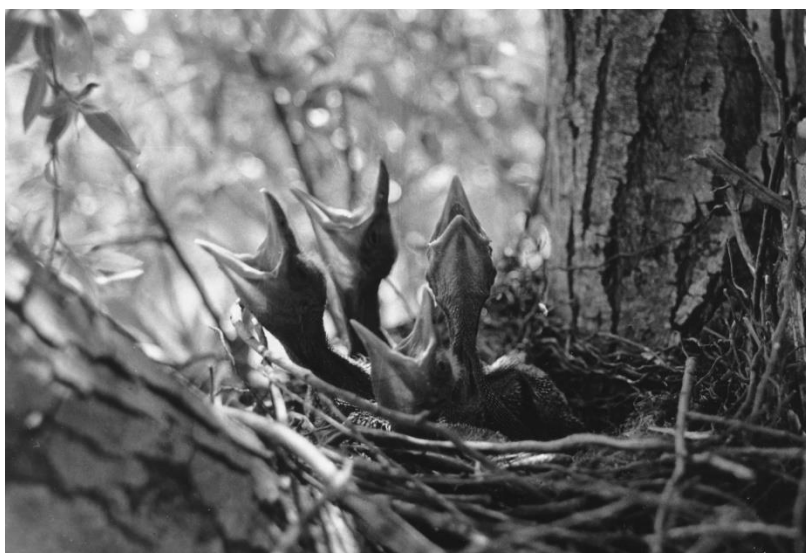
23. Briga za potomstvo

animatora u tramvaju, 99 a truba zvukovno imitira padanje zgužvanih crteža nezadovoljna animatora u koš za smeće te animirano hodanje i zijevanje lika kojeg je animator nacrtao. Imitatorski efekt ostvaruje se i upotrebom prirodnog zvuka, kada se zvukom udaranja pisaćeg stroja imitira lupkanje animatora prstima po glavi, čime se metaforično ukazuje na činjenicu da animator u glavi stvara ideju o svom crtiću. U filmu Baltazar putuje činele bubnja imitiraju Baltazarovo rušenje ljudi i stvari, a kada Baltazar odgurne cijeli red ljudi, čuje se zavijajući zvuk trube. U filmu o prirodi Briga za potomstvo (Branko Marjanović, 1959, HRV), pak, žustri zvuci puhaćeg instrumenta imitiraju energično otvaranje usta gladnih ptića (fotografija 23), klavirski akcent imitira batrganje leptira u paukovoju mreži, zviždukanje flaute imitira glasanje kolibrića, a puhaći instrument imitira ptice koje se podrugljivo smiju orlu koji ih nije uspio uhvatiti, kako nam sugerira narator.