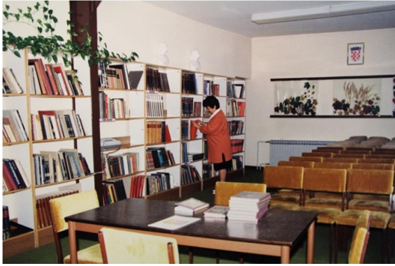
Slika 8. Čitaonica u prostorubanke