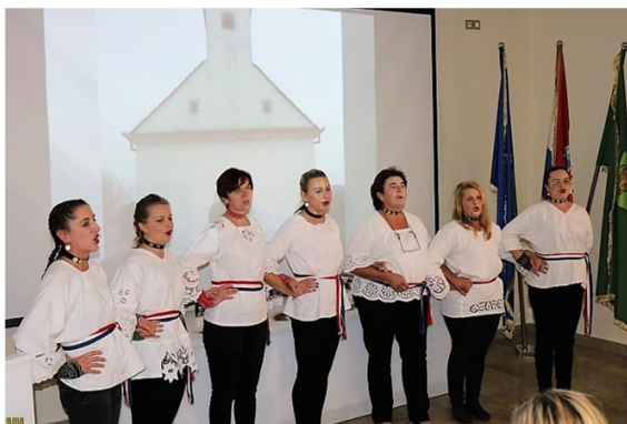
Slika 13. Bećarac u Pleternici, nastup KUD-a Svilenka