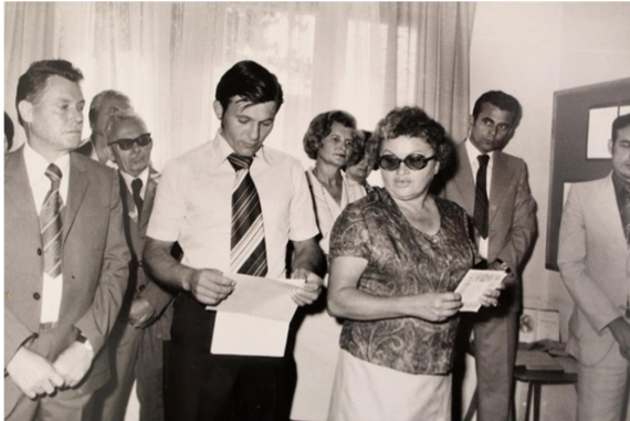
Slika 5. Otovrenje prostora u zgradi Mjesnog ureda

dječja i omladinska knjižnica i čitaonica, čitaonica za odrasle te knjižnica za odrasle). Prostor knjižnice pruža i mogućnost postavljanja izložbi.