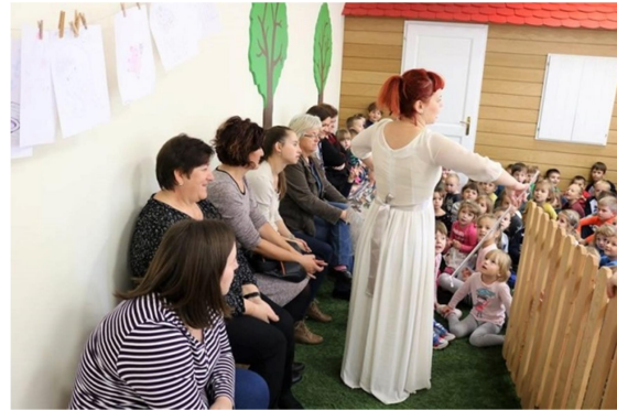
Slika 17. Posjet DV Tratinčica u Mjesecu hrvatske knjige

Knjižnica osim vlastitih aktivnosti sada pruža prostor i za održavanje raznih poslovnih seminara u organizaciji Grada Pleternice i Poduzetničkog centra Pleternica 107 te međunarodnih stručno edukacijskih simpozija poput Štamparovih dana u organizaciji Udruge narodnog zdravlja Andrija Štampar o zdravim stilovima života 108 , a posebno se ističe i