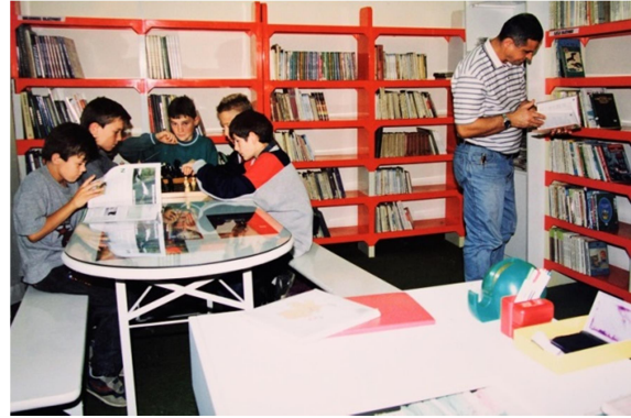
Slika 9. Dječji odjel u prostoru banke

U ovome razdoblju posebno se ističe kulturna aktivnost knjižnice gostovanjima eminentnih stvaralaca i znanstvenika Hrvatske, ali i obrazovna uloga provedbom igraonica te izvrsnom suradnjom s osnovnom školom. U knjižnici se pojačane aktivnosti odvijaju posebno u vrijeme LIDAS-a (Lipanjski dani amaterskog stvaralaštva u Pleternici) te Mjesecu knjige. Na temelju Odluke Gradskog vijeća 4. studenog 1994. pleternička knjižnica postaje samostalna ustanova i izdvaja se iz matične knjižnice u Požegi. 86 Knjižnica 1991. vraća naziv Hrvatska knjižnica i čitaonica Pleternica na inicijativu povjesničara i Pleterničanina Dragutina Pavličevića te 1994. pod tim nazivom prelazi u samostalnu ustanovu. Unatoč Domovinskom ratu Knjižnica radi bez prekida sa svim svojim aktivnostima. Djelatnici knjižnice bili su uključeni u prikupljanje pomoći za branitelje te je knjižnica pružala utočište i svim izbjeglicama bez obzira na nacionalnost i vjeroispovijest. 87