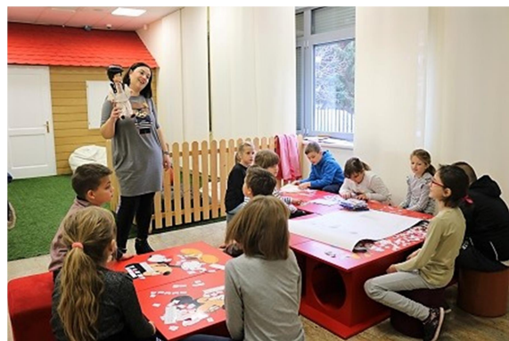
Slika 14. Škola bećarca za djecu