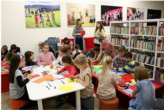
Slika 16. Promocija projekta Svijet kroz dječje oči Društva naša djeca Pleternica

vrćica i prvih razreda u Mjesecu knjige posjećuju knjižnicu te sudjeluju u radionicama, edukativnim obilascima i postaju članovi knjižnice. Suvremena tehnologija na raspolaganju je djeci, ali i odraslim te se u prostoru knjižnice mogu služiti stolnim, ali i tablet računalima. Prostor knjižnice nudi i mogućnost cjeloživotnog obrazovanja te se u prostoru knjižnice provode i edukacije koje organiziraju udruge putem europskih i nacionalnih potpora, ali i u organizaciji knjižničara. Knjižnica u suradnji s udrugama Hrvatsko žensko društvo, Društvo naša djeca Pleternica, Udruga za pomoć djeci s poteškoćama u razvoju „Osmjeh“ te Udruga Radost, ali i ustanovama svoj prostor pretvara za učenje i individualno usavršavanje iz područja povijesti, psihologije, pedagogije i dječjih prava.