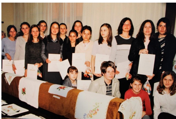
Slika 10. Izložba polaznica Škole veza Hrvatskog ženskog društva Pleternica