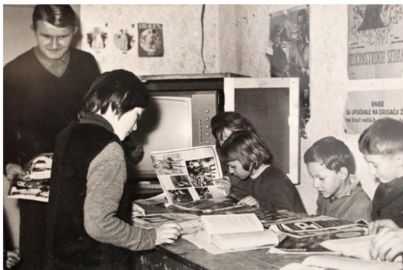
Slika 3. Prostor Osnovne škole u Pleternici