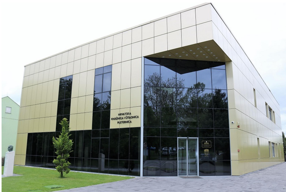
Slika 12. Hrvatska knjižnica i čitaonica Pleternica (6. svibnja 2019.)

Tijekom 2014. godine knjižnica još uvijek djeluje u starom prostoru te se priprema i s nestrpljenjem očekuje preseljenje. Početkom prosinca 2014. godine stara knjižnica se zatvara za korisnike tijekom tri dana te uz pomoć učenika Osnovne škole fra Kaje Adžića seli u novu zgradu. Učenici i učitelji stvorili su živi lanac dužine 150 metara od postojeće knjižnice do novog prostora. Ukupan fond knjižnice prenesen je zahvaljujući angažiranosti učenika, učitelja i djelatnika knjižnice. 97 Nova suvremena zgrada knjižnice sagrađena je tijekom 4 godine u užem centru grada uz pomoć bespovratnih sredstava u iznosu od 12 milijuna kuna dobivenih putem natječaja i bespovratnih sredstava Ministarstva kulture, Ministarstva regionalnog razvoja i Fonda za zaštitu okoliša i energetska učinkovitost uz zalaganje Grada Pleternice. 98 Hrvatska knjižnica i čitaonica danas ispunjava sve prostorne uvjete za obavljanje svojih djelatnosti. Zgrada knjižnice ističe se svojom vanjskom vizurom u samom središtu grada te i dalje knjižnica nastavlja s različitim aktivnostima.