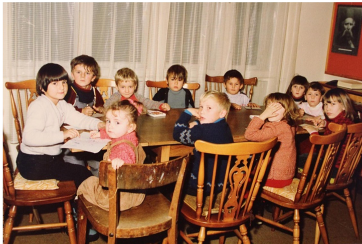
Slika 7. Igraonica u Narodnoj knjižnici i čitaonici Pleternica 1987. godine

Samostalnost kao ustanova knjižnica u Pleternici gubi 1981. te postaje dio bibliotečne djelatnosti Centra za kulturu i obrazovanje Požega. Svoju djelatnost ne mijenja ulaskom u Centar te nastavlja redovne aktivnosti uz priređivanje izložbi, predavanja i susreta, knjigu nastoji približiti korisnicima te i dalje postoji nekoliko pokretnih knjižnica po selima. Kulturna djelatnost knjižnice uspješno se nastavlja te posebno ističe tijekom „Mjeseca knjige“ iako se nije ostvarivao plan nabave knjiga početkom 80-ih godina zbog nedostatka financijskih sredstava. Zbog teže financijske situacije smanjuje se pretplata na tisak te knjižnica nabavlja samo Vjesnik, Večernji list i Našu knjigu. Knjižnica unatoč teškoj financijskoj situaciji svoje aktivnosti povećava te 1987. godine započinje igraonica za djecu u čijem radu stručnu pomoć volonterski pružaju učitelji Osnovne škole u Pleternici. 79