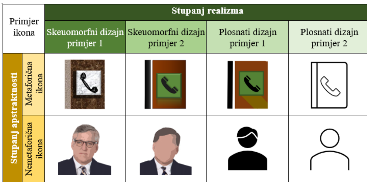
Slika 2. Primjeri metaforičnih i nemetaforičnih, kao i plosnatih i skeuomorfnih ikona za ikonu imenika na pametnom uređaju

Cho i suradnici (2015) navode kako se rezultati njihovog istraživanja podudaraju s rezultatima drugih istraživanja na istu temu te zaključuju kako apstraktnost utječe na razumijevanje značenja ikona kod starijih korisnika pametnih telefona i kako im je potreban neki vizualni znak kako bi uspješno pogodili njezinu funkciju. Na temelju takvih zaključaka, jasno je za razumjeti zašto se starije osobe koje su tek počele koristiti pametne telefone, ili su ih počeli koristiti nakon razdoblja prelaska sa skeuomorfnog dizajna na plosnati, teško snalaze na sučeljima i često griješe ili zbunjeno promatraju u ekran prilikom traženja određene funkcije uređaja. Iz tog bi razloga dizajneri sučelja pametnih telefona trebali razmotriti mogućnost prilagođavanja dizajna, odnosno ponuditi mogućnost odabira skeuomorfnog ili plosnatog dizajna, kako bi samo korištenje uređaja u starijih korisnika bilo uspješnije.