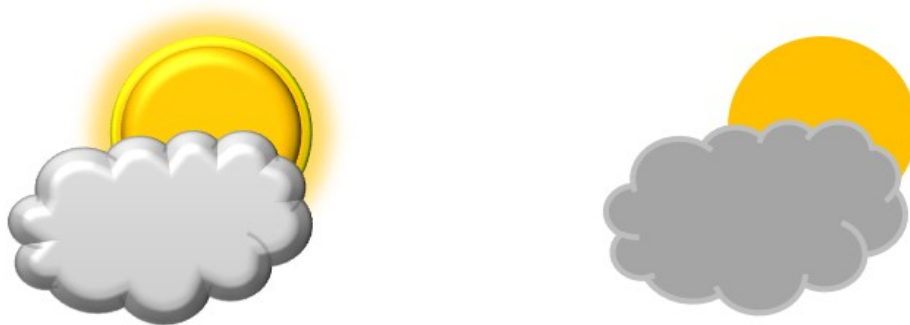
Slika 1. Razlika između skeuomorfnog dizajna (desno) i plosnatog dizajna (lijevo) na primjeru ikone za aplikaciju vremenske prognoze

ikona i logoa stvarnom životu – to znači kako takve ikonske reprezentacije imaju sjenke, dubinu, odsjaj i općenito su osmišljene da nalikuju 3D objektima. Gu i Yu (2016) skeuomorfni dizajn objašnjavaju „kao način oponašanja objekata iz stvarnog svijeta i korištenje realizma s lažnim teksturama, sjenkama i vizualnim metaforama“ (str. 233). Suprotnost takvom dizajnu jest plosnati, 2D dizajn, minimalistički s malo boja, bez sjenki i odsjaja (vidi sliku 1.), a upravo je popularnost takvog dizajna počela prevladavati početkom 2010-og desetljeća.