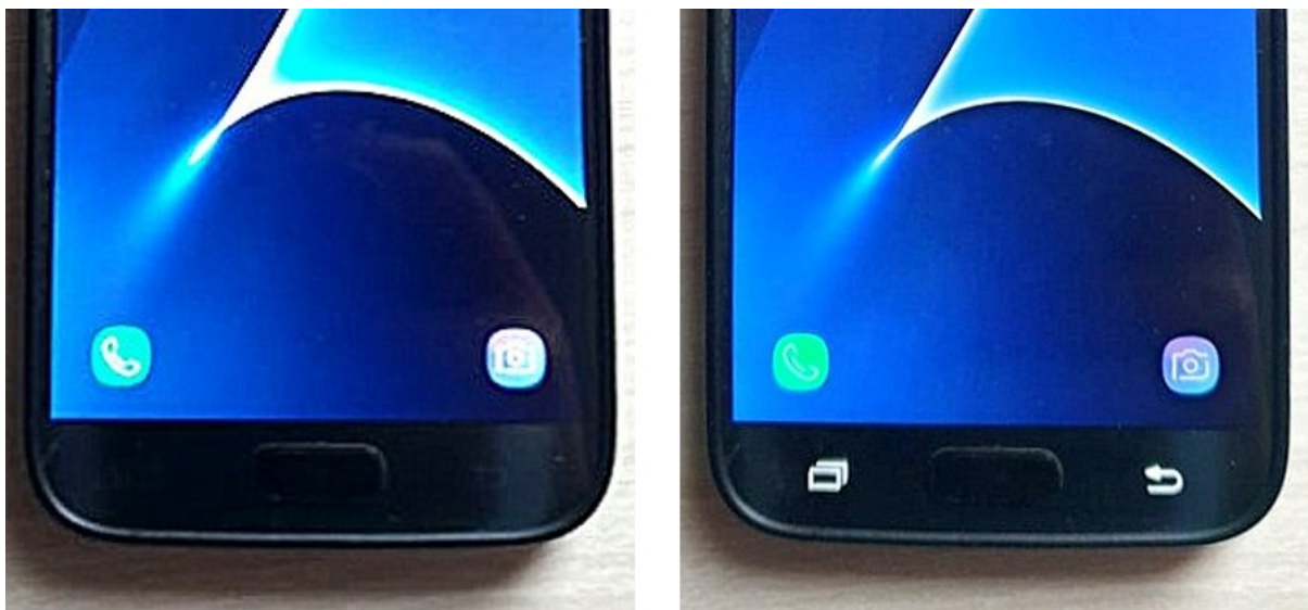
Slika 5. Primjer uređaja s osvjetljenom strelicom (desno) za vraćanje unatrag. Dodirom na taj dio površine uređaja, uključuje se LED-lampica koja osvjetli tipku i učini ju vidljivijom.

Sudionik radi bolesti ima oštećeno kratkotrajno pamćenje, što se najviše primjećuje kada je na uređaju potrebno odabrati tipku za vraćanje unatrag. Naime, uređaj kojeg posjeduje sudionik nema vidljivu strelicu koja označuje da je riječ o navedenoj tipki, već je strelica vidljiva tek nakon što se pritisne taj dio uređaja što uzrokuje paljenje led lampice koja osvjetli strelicu (vidi sliku 5.). Problem je što led svjetlo osvjetljuje strelicu u trajanju od 1.5 sekunde, što je za sudionika prekratko da reagira, a kako je riječ o uređaju bijele boje, volonterka je crnim markerom na donjem dijelu uređaja nacrtala simbol za strelicu, kako se sudionik više ne bi bunio i neuspješno tražio strelicu za vraćanje unatrag. Do idućeg sata tjedan dana kasnije, strelica je izbljedjela no kada ju je ponovo htjela nacrtati, sudionik je rekao kako nije potrebno jer se naviknuo i zapamtio gdje je i čemu služi tipka.