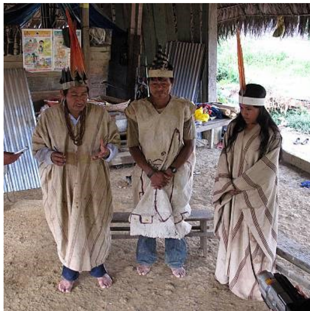
Slika 3: Pripadnici Huachipaire naroda 10

Eshuva pjesme su temeljni dio kulture Huachipaire zajednice, ali i Harákmbuta općenito, te im daju osjećaj pripadnosti i identiteta. One prenose njihove tradicije i vrijednosti, odražavaju njihova vjerovanja i misli te su važan element njihovog svjetonazora. Danas se, zbog iseljavanja stanovništva i nezainteresiranosti mlađih generacija, Eshuva smatra ugroženom. Iz tih razloga broj aktivnih pjevača je vrlo malen. U 2011. godini je bilo poznato samo dvanaest aktivnih pjevača i svi su pripadali dobnim skupinama iznad 40 godina. Na njenu ugroženost dosta utječe i miješanje Huachipaire grupe s drugim etničkim grupama te negativni stavovi i nepoštovanje tradicije Eshuve od strane okoline. Zato je Eshuva 2011. godine stavljena na Listu nematerijalne kulturne baštine kojoj je potrebna hitna zaštita kako bi se mogla osigurati sredstva i načini da se ova nematerijalna kulturna baština zaštititi i očuva (UNESCO 2011).