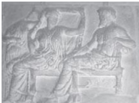
Slika 12: Odljev istočnog dijela partenonskog friza koji prikazuje Zeusa i Heru, FFZG I. kat - sjeverni hodnik 20

Još jedan primjer povezanosti nematerijalne i materijalne kulturne baštine je Kitano Tenmangu hrama u Japanu. Kitano Tenmangu hram je hram u Kyotu posvećen Sugawara no Michizaneu, japanskom učenjaku, kojeg su nakon smrti počeli štovati kao boga pod imenom Tenjin (Kitano-Tenmangu, n.d.). Prema legendi, nakon njegove smrti grad su pogodile bolesti i prirodne nepogode te se smatralo da ih prouzrokuje Michizaneov duh. Kako bi ga umirili, izgradili su hram u njegovu čast i počeli ga štovati kao boga (The Metropolitan Museum of Art, n.d.).