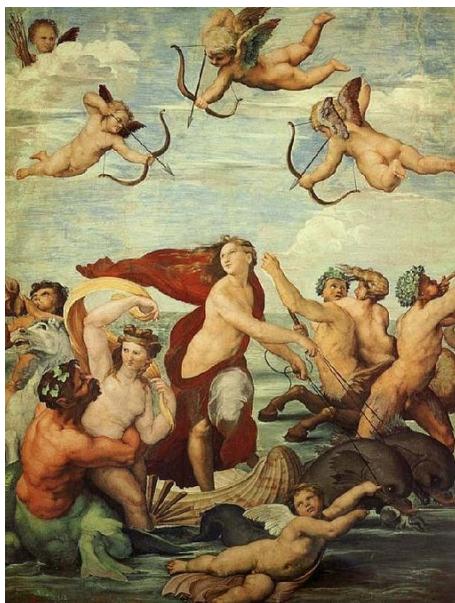
Slika 7: Rafael, Galatea , 1514., Villa Farnesina, Rim 15