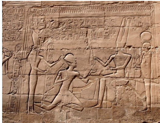
Slika 8: Reljef koji prikazuje Ramzesa II., boga Amona i Khonsua te božicu Mut, Hipostilna dvorana, Amonov hram, Karnak 16

Stare civilizacije su oslikavale posude i zidove hramova i grobnica događajima i likovima iz vlastitih religijskih mitova. Drevni Egipćani su oslikavali zidove grobnica prikazima raznih božanstva, u svrhu zaštite pokojnika, i temama zagrobnog života. Arheološko nalazište Karnak je dobar primjer kompleksa drevnih egipatskih hramova u kojemu možemo vidjeti razne skulpture, primjerice skulpturu božice Sekhmet kao što je prikazana na Slici 9, te stupove ukrašene reljefima koji prikazuju egipatske vladare, rituale i bogove, kao što se vidi na Slici 8. Područje tog nalazišta je posvećeno bogu Amonu, ali su odavali počast i drugim bogovima, kao božici Mut i Izidi, bogu Khonsuu, Ozirisu i Montu (Mark 2016).