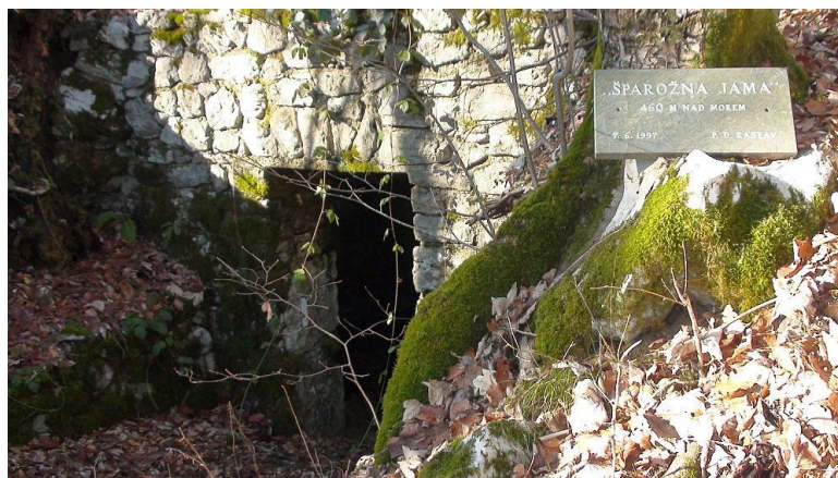
Slika 5: Ulaz u Šparožnu jamu 13

Neki kažu da su se Šutan i Jana uspjeli spasiti uz Malikovu pomoć te da su živjeli sretno i da je cijeli grad Kastav nastao od njih. Oni koji su bili u Šparožnoj jami tvrde da su njezine podzemne dvorane zapravo Hajdini dvori. Kažu da se još uvijek mogu razaznati raskošne zavjese, haljine i okamenjena mreža kojom su pokušali uhvatiti Sunce, a na samom dnu je navodno kameni stup, nalik Hajdinom princu, upleten u bršljan, kao u ruke Jane Bršljančeve (Jardas 1994 u Fumić 2018).