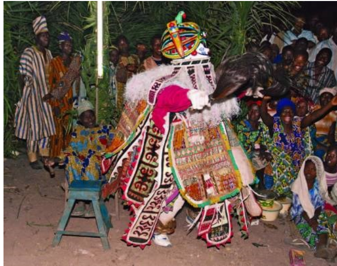
Slika 2: Kostimirana i maskirana osoba tijekom ceremonije Gelede 5

folklorni proizvod. Ipak, Gelede zajednica pokazuje veliku svijest o vrijednosti i potrebi za očuvanjem nematerijalne baštine, što se odražava u naporima koji se ulažu u pripremu za svečanost i u sve većem broju sudionika. Uz to ceremonija Gelede je uvrštena na UNESCO-ovu Reprezentativnu listu nematerijalne kulturne baštine čovječanstva (UNESCO „Oral heritage of Gelede“).