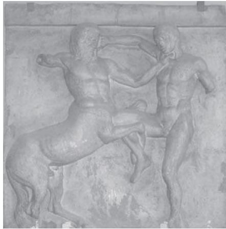
Slika 11: Odljev metope južne strane Partenona koji prikazuje borbu kentaura i Lapita, FFZG I. kat - zapadni hodnik 19