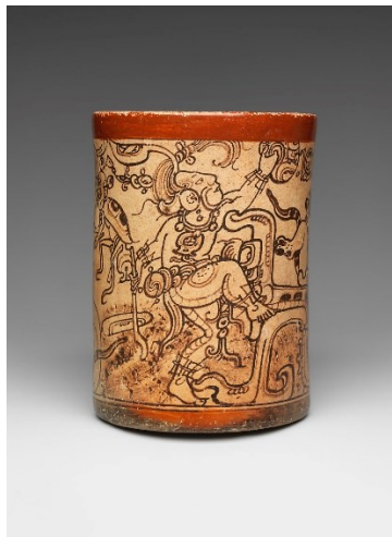
Slika 10: Majanska keramička posuda koja prikazuje boga Chahka te suprotnost smrti i kiše koja daje život, 7.-8. stoljeće, Guatemala 18

Primjere oslikanih posuda s mitološkim temama možemo naći i u ostacima majanske civilizacije (Slika 10). Njihovi mitovi su često bili povezani s poljoprivredom, tako da su neki od važnijih i cjenjenijih bogova bili bog kiše Chahk te bog kukuruza (engl. Maize god ), pošto je kukuruz bio njihova glavna i najvažnija žitarica.