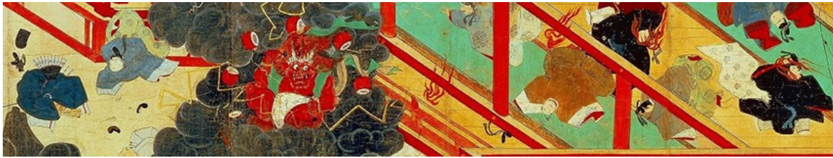
Slika 13: Prikaz munje koja pogađa Seiryōden u Carskoj palači u Kyotu (Volumen 6, dio 3), 1219., Kitano Tenmangu hram, Kyoto 21

n.d.). Primjer jednog takvog sveska se može vidjeti na Slici 13, gdje je prikazan dio sveska koji govori o munjama koje pogađaju Carsku palaču, a prouzrokuje ih Michizaneov duh.