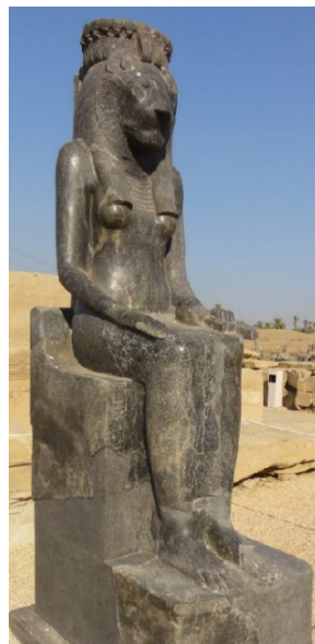
Slika 9: Skulptura božice Sekhmet, Okug božice Mut, Karnak 17