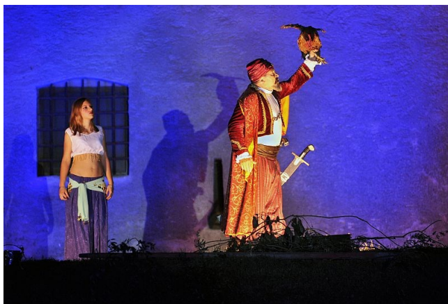
Slika 4: Scena iz predstave Legende o Picokima 11

Središnja predstava manifestacije se bazira na Legendi o Picokima , đurđevačkoj narodnoj predaji nastaloj u 16. stoljeću za vrijeme osmanskih napada. Predaja govori o obrani đurđevačke utvrde od napada Osmanlija. Nakon neuspjelih osmanlijskih opsada Đurđevca Osmanlije su čekale da branitelji utvrde izgladne i predaju se, ali jedna je starica predložila braniteljima da ispale picoka (pijetlića) iz topa u neprijateljski tabor. Kada su Osmanlije to vidjele pomislili su da stanovnici imaju hrane na pretek i odustali su od opsade. Tako su Đurđevčani dobili nadimak Picoki . Predstava je prvi put sastavljena u sklopu VI. susreta mladih sjeverozapadne Hrvatske u Đurđevcu, s namjerom da se dočara autentičan prikaz napada Osmanlija i objasni kako su Đurđevčani dobili ime Picoki . Zahvaljujući toj izvedbi kasnije je i nastala Picokijada . Sama legenda je 2007. godine upisana u Registar kulturnih dobara Republike Hrvatske, a grad Đurđevac je 2008. godine proglašen nacionalnim pobjednikom za Europsku destinaciju turističke izvrsnosti koji čuva i njeguje nematerijalnu kulturnu baštinu (Miholek 2018).