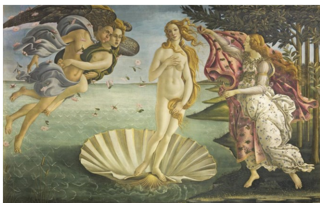
Slika 6: Sandro Botticelli, Rođenje Venere , c. 1485., Galerija Uffizi, Firenca 14

Iako se ovaj rad fokusira na nematerijalnu kulturnu baštinu, važno je istaknuti i utjecaj mitova i legendi na materijalnu kulturnu baštinu. Mnoge civilizacije su različitim metodama prikazivale svoje mitove i legende na svakodnevним predmetima i u sklopu arhitekture. Legende i mitovi su s vremenom počeli gubiti značaj i funkciju koju su imali u društvu, ali su i dalje ostali kao inspiracija mnogim umjetnicima iz raznih područja. Neki od najpoznatijih europskih slikara često su kao temu koristili elemente iz priča klasične grčke i rimske mitologije. To se može vidjeti u primjerima poput: Rođenje Venere (Slika 6) i Proljeće S. Botticellija, Rafaelovom djelu Galatea (Slika 7), Narcis Caravaggia, i sl.