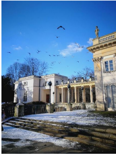
Slika 1 Palac na Wodzie (Łazienki Królewskie), 24.2. 2018.

„autentično“ te to da se krećem prostorom u kojemu se odvija radnja jednoga od meni najdražih romana.