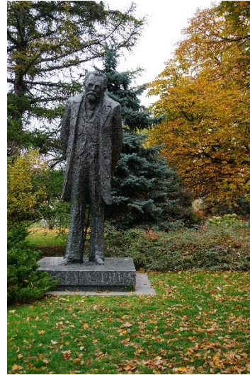
Slika 5 Spomenik Boleslawu Prusu na križanju Krakovskog Predgrađa i Karowe, 19.10.2019.

Konačno, osvrćući se na svoje iskustvo, shvatila sam da mi je teško razgraničiti iskustva mojih boravaka u Varšavi s obzirom na to da se u oba slučaja moja motivacija i način doživljaja grada nisu znatno mijenjali. Ono što se mijenjalo bili su kolege, poneka putovanja u slobodno vrijeme i tek neki kolegiji prema kojima bih jasno mogla sistematizirati boravke. Spomenula sam da se pred kraj mojeg zadnjeg boravka moj odnos prema gradu ponešto promijenio zbog fokusa na suvremene društvene probleme u Poljskoj koje sam viđala tijekom boravka u prostoru. Međutim, povratkom kući, osjećam se kao da sam to iskustvo potisnula jer mi se grad sa sve većim vremenskim odmakom ponovno čini egzotičnim i romantičnim, posebno kada pregledavam fotografije i ponovno razmišljam o iskustvima koje sam tamo doživjela.