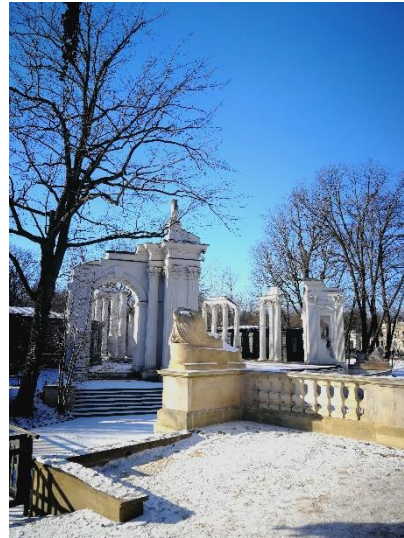
Slika 2 Amfiteatr (Łazienki Królewskie), 24.2.2018.

Svoj sam boravak u najvećem dijelu provela na predavanjima na kolegijima Sveučilišta u Varšavi za koje smatram da sam su mi omogućili još dublje uranjanje u poljsku kulturu i književnost. Dio kolegija koje sam pohađala bili su namijenjeni stranim studentima i osobito mi se u sjećanje urezao profesor koji je na predavanju o Julianu Tuwimu kao dijelu kolegija Suvremena poljska književnost pokušavao dočarati kretanje pjesnika kroz prostor Varšave. Sjedili smo u Palacu Tyszkiewiczów-Potockih koji je za moje pojmove bio vrlo raskošan akademski prostor, u učionici koja je gledala na Krakovsko Predgrađe. Predavanje je započeo rečenicom: „Vidite li ovu ulicu kroz prozor? Sada zamislite da je početak 20. stoljeća i da vidite kako se kočijom vozi Julian Tuwim“. Osim što sam i prije boravka grad doživljavala kao iznova građen prostor u kojemu su velikim dijelom izbrisani tragovi prošlosti, činilo se da su Varšavu tako doživljavali i moji profesori jer bi vrlo često pripovijedali o povijesnim događajima koje su se događali negdje oko mjesta na kojem smo se trenutno nalazili. Ti su se osvrtni najčešće odnosili na zgrade Sveučilišta koje su, prije nego što su dobile svoju akademsku namjenu,