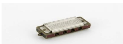
Slika 4 7