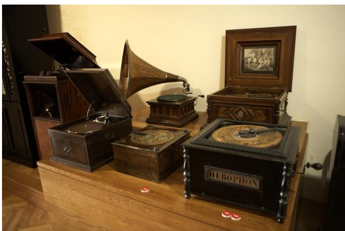
Slika 3 6