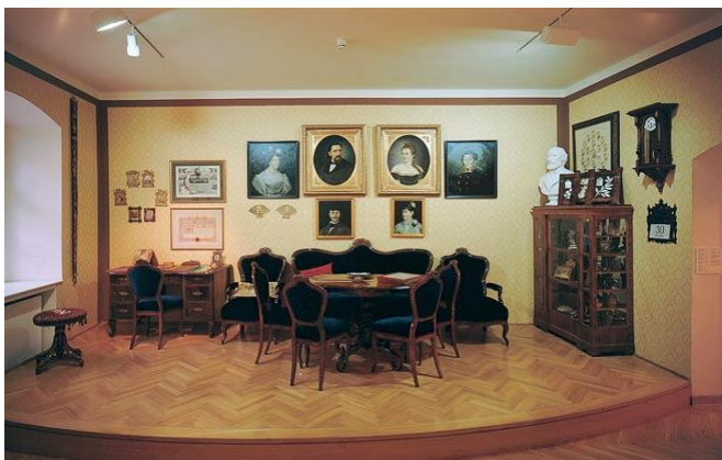
Slika 1 4

U altdeutsch (staronjemačkoj) vitrini, smješteni su vrijedni dirigentski štapići ukrašeni zlatom i srebrom s ugraviranim prigodnim natpisima koji su mu darovani na opernim premijerama. Dio Zbirke čine i notna izdanja njegovih skladbi.