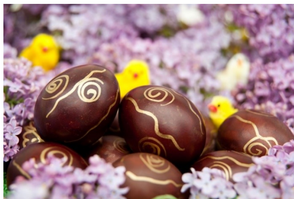
Slika 9. Uskrsna jaja: vječni simbol novog života, autorica: Roberta F.

U katoličkoj se vjeri bojanje jaja odvija na Veliku subotu, dok pravoslavci taj običaj izvode na Veliki petak. Kupovne boje koje danas prevladavaju zamijenile su tradicionalno bojanje jaja prirodnim pigmentima, napravljenim od trava, cvijeća i kore drveća. Običaj se ipak djelomično zadržao do danas te dio stanovništva Moravica još uvijek koristi ljuske luka, kore cikle i listove koprive kako bi dobili prirodne nijanse smeđe, crvene i zelene boje. Pravoslavni vjernici koji odlaze u crkvu na Uskrs dobivaju po jedno jaje koje čuvaju u kući do idućeg Uskrsa. Također, običaj darivanja, odnosno razmjenjivanja jaja rasprostranjen je među vjernicima obje vjeroispovijesti koje se, prema Marcelu Maussu „... temelji na nerazdvojuju jedinstvu osobe i darovne stvari. U daru je sadržan dio osobe koja ga poklanja, te on stvara neku vrstu materijalno-duhovne veze između darovatelja, povezujući ih na specifičan duhovni način“ (ibid. 146).