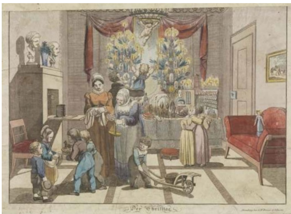
Slika 5. Der Christtag , Fundus: Germanisches Nationalmuseum, Nürnberg

U hrvatskoj kulturi, od samog početka kršćanskog života, Božić je prihvaćen kao najveseliji i najrasprostranjeniji kršćanski blagdan te najomiljeniji religijski datum u narodnoj običajnosti (ibid. 6). U knjizi Dunje Rihtman Auguština Božić je definiran kao dan kada se slavi rođenje Isusa, Sina Božjeg te predstavlja dan mira i veselja. Kršćanski mir, kako predlaže Bonaventura Duda, odnosi se na boljitak, napredak i blagostanje svijeta, dok je Isus „svijeta razveseljitelj“ (Rihtman Auguština 1992:7).