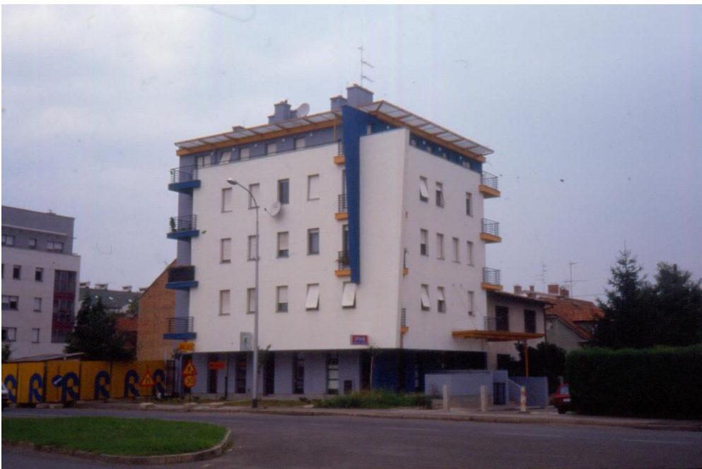
Slika 21 - Maroević - Zagreb, stambena zgrada, Iločka 34-Vukovarska, pogled s jugoistoka

Ova zgrada na uglu Ulice grada Vukovara i Iločke ulice nosi adresu Iločka 34 te je bila krivo spremljena u digitalnoj Zbirci „Maroević“. Ona se sastoji od pet etaža te ponavlja elemente zgrade koja se, u trenutku snimanja, nalazi pokraj nje. Oblici prozora su istog oblika, zadnja etaža koja sadrži dugačke balkone, a i same boje koje su korištene te na kojim dijelovima prikazuju održavanje ritma između ova dva objekta. Balkoni koji se nalaze na uglovima zgrade su također ponovljeni element, ali dio koji ju ističe jesu dijagonalni istaci na jugoistočnom kutu koji dodaju dinamici same građevine.