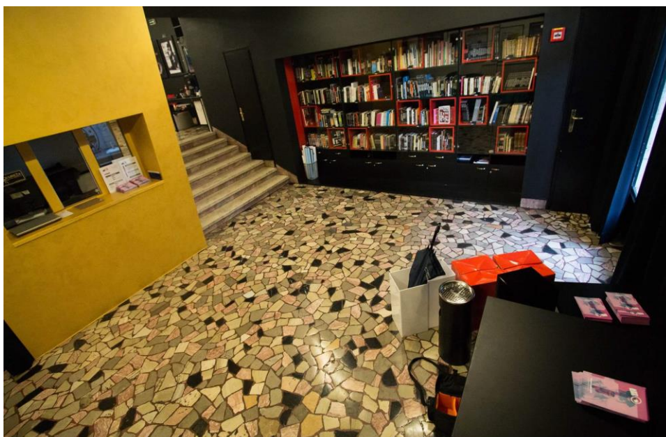
Fotografija 2: Atrij Kina - unutrašnjost Knjižnice