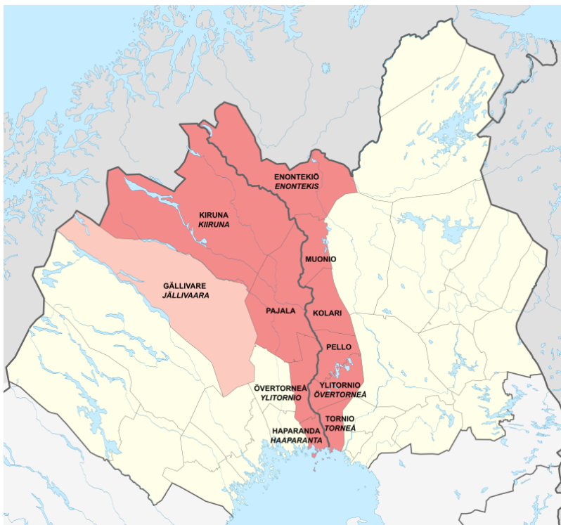
Figur 3 - Tornedalen

Tornedalen, (Meänmaa på meänkieli – ”vårt land”), är ett område i norra Sverige som omger Torne älv. Torne älv utgör också ungefär 190 km av gränsen med Finland från Lappea till Bottenviken. Förutom de två rikena delade 1809 Torne älven det finskspråkiga Tornedalen i en svensk och en finsk del när Sverige avträdde Finland till Ryssland. (Hyltenstam, 1999: 98)