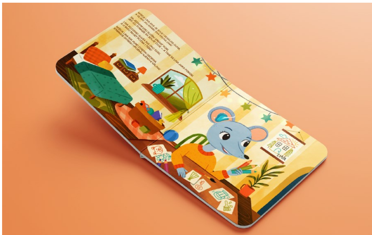
Slika 3. Prikaz otvorenog dvostraničja