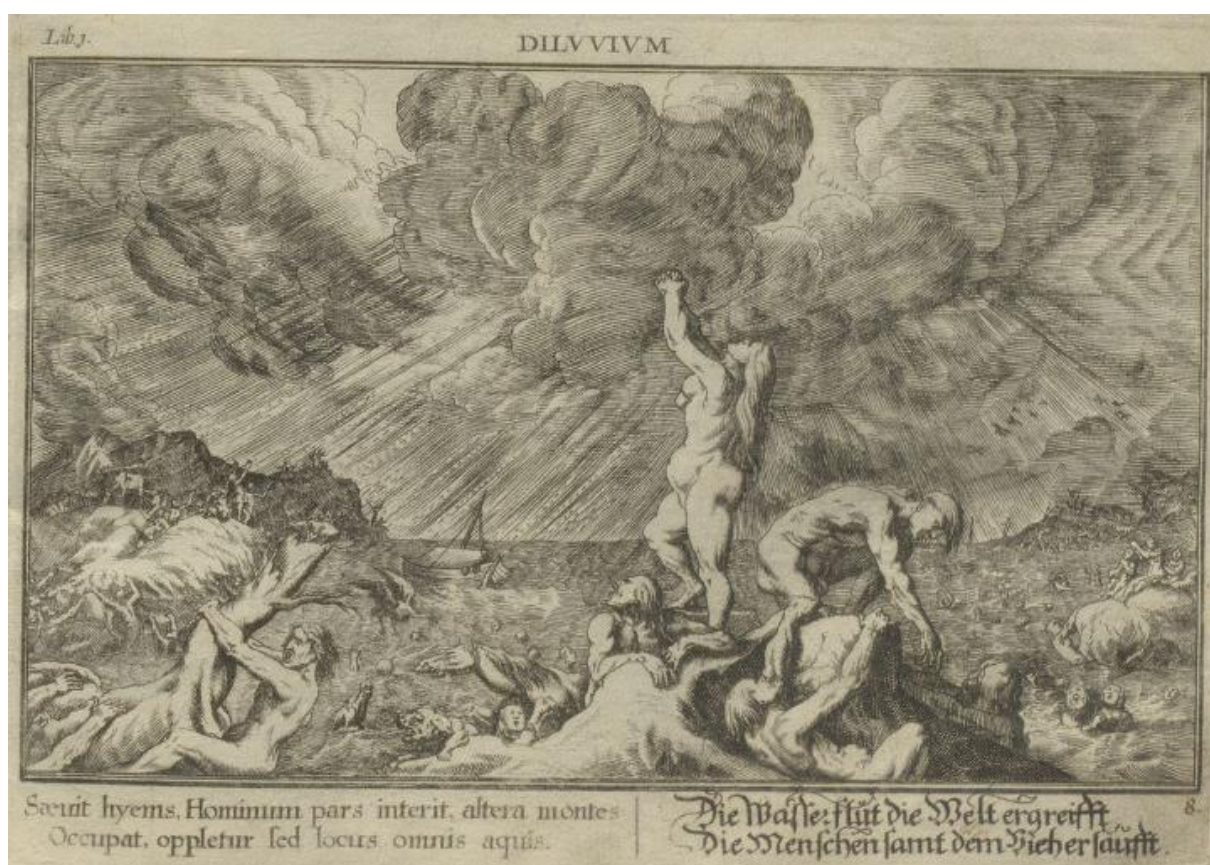
SLIKA 15. Abraham Aubry, Poplava , Sveučilišna knjižnica Erlangen-Nürnberg.