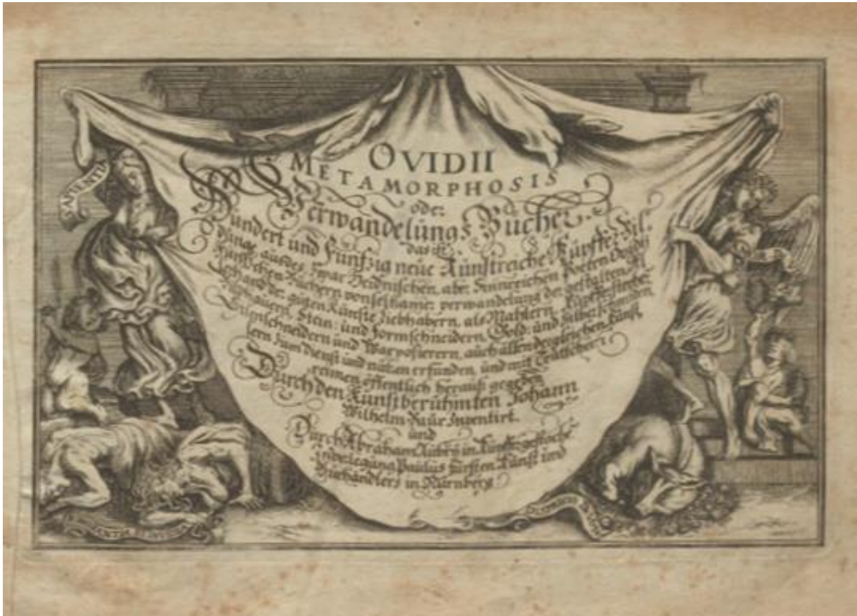
SLIKA 10. Abraham Aubry (prema Bauru), gravirana naslovnica Ovidijevih Metamorfoza , primjerak u Sveučilišnoj knjižnici Erlangen-Nürnberg

Nakon gravirane naslovnice slijedi tiskana naslovnica s latinskim tekstom (SL.11):