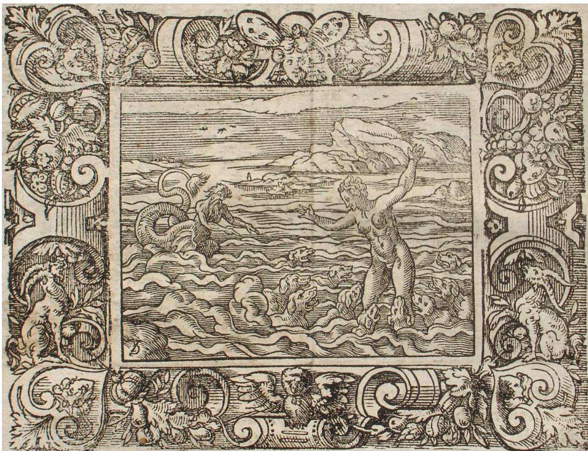
SLIKA 31. Virgil Solis, Scilina preobrazba , drvorez, iz: P. OVIDII METAMORPHOSIS, izdavač Sigmund Feyerabendt, Frankfurt, 1581.

Antonio Tempesta, Scilina preobrazba , 1606., bakropis, dimenzije 105 x 120 mm (SL. 32). Bez signature. Grafika je obrubljena jednostavnim linijskim okvirom te ispod slikovnog prikaza teče numerirani tekst u kurzivu: 131. Scylla Circes veneficijs in mostrum marinum kojim se objašnjava da je Kirka odgovorna za Scilinu pretvorbu u morsko čudovište. Tempesta koristi isti ikonografski obrazac kao Solis, gdje je Scila prikazana do koljena u moru sa psima koji joj se približavaju te Glaukom u pozadini koji pliva prema njoj. Scila je kod Tempeste prikazana poprilično mirna, u usporedbi sa Solisovom Scilom. Psi oko njenih nogu uzburkavaju valove i bijesno laju prema njoj, dok se ona naginje u boku i postavu rukama kao da je prihvatila svoju sudbinu. Njeno lice je mirno dok pogledava prema psima, za razliku od Glaukovog šokiranog lica u pozadini. Tempesta laganim vijugavim potezima izvodi valove oko bijesnih pasa kako bi dočarao njihove pokrete, dok je more iza njih poprilično mirno. Horizont je još viši od Solisovog, što dodatno ostavlja osjećaj mirnoće koji je zanimljivo s obzirom na užasavajuću preobrazbu.