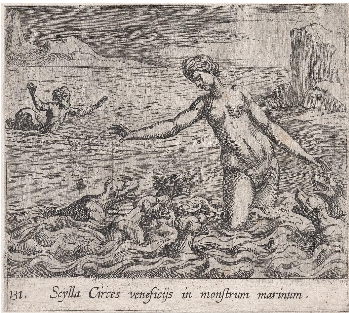
SLIKA 32. Antonio Tempesta, Scilina preobrazba , bakrorez, 1606., The Metropolitan Museum of Art

Johann Wilhelm Baur, Scilina preobrazba , 1641.(?), bakropis, dimenzije 125 x 204 mm (SL. 33). Grafika je isto orijentirana kao grafika u albumu Abrahama Aubryja. Bakropis je bez okvira te je rezan do slike. Baur u potpunosti ne slijedi ikonografsku formulu Solisa i Tempeste; njegova Scila je naizgled sama u borbi s psima. Događaj je postavljen u monumentalni morski krajolik, niskog horizonta s velikim gromadama kamena kao na prethodnoj sceni Glauk i Scila . Scila je prikazana leđima okrenuta od promatrača dok se bjesomučno okreće oko vlastite osi dok joj psi proizlaze iz bedara koja su otrovana morem. U prikazanom trenutku su njena bedra već rastopljena u tijela pasa te su prikazana spojena s pasjim leđima. Taj doista grozomoran trenutak preobrazbe dodatno je naglašen Scilinom samoćom prvog plana unutar tog monumentalnog morskog pejzaža. S lijeve strane u pozadini je Glauk prikazan izuzetno malen, čime se naglašava njegova udaljenost od zastrašujućeg događaja. U daljini iza Scile, iz oblaka