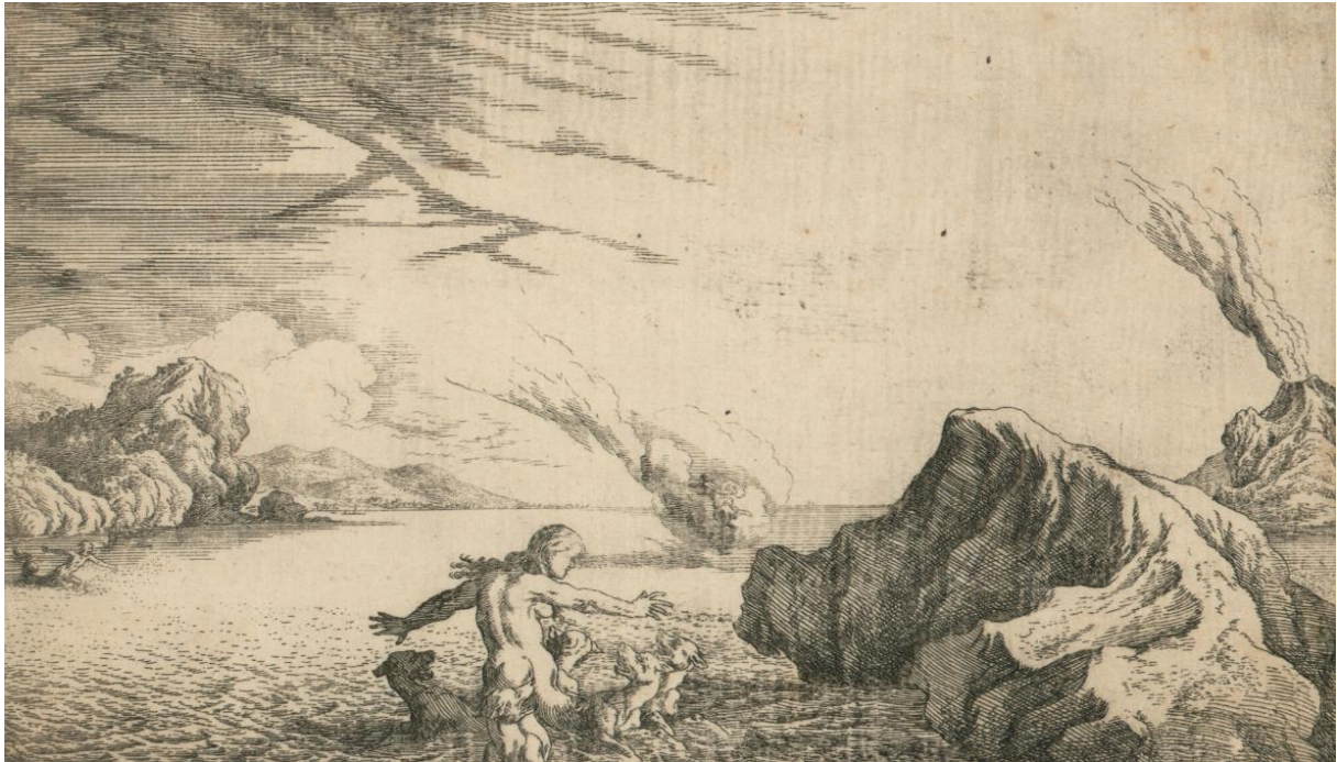
SLIKA 33. Johann Wilhelm Baur, Scilina preobrazba , bakropis, 1641.?, Grafička zbirka Nacionalne i sveučilišne knjižnice u Zagrebu

se nazire figura Kirke koja bježi s mjesta zločina nakon što je otrovala more. Uz desni rub kadra u dalekoj eruptira Etna, kao da u samoći parira Scilinoj nesreći.