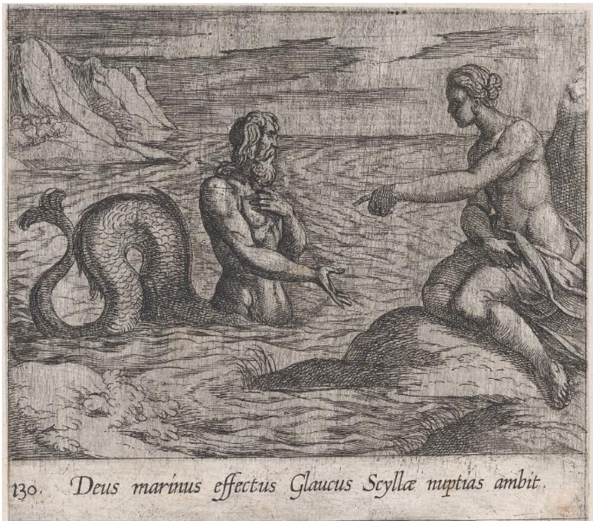
SLIKA 27. Antonio Tempesta, Glauk i Scila , bakrorez, 1606., The Metropolitan Museum of Art

grafici Tempesta najviše bavi figurama, što se vidi na Glaukovoju desnoj ruci s fino naglašenim mišićima nadlaktice i podlaktice. Na njegovom su licu vidljive bore i podočnjaci (SL. 28), a kosa je izvučena u pramenovima vijugavih linija. Glaukov torzo definiran je igrom svjetla i sjene, gdje svaki mišić ima prazan, neobrađeni dio plohe koji se razbija postepenom sjenom šrafiranja. Njegov rep izveden je na tipičan Tempestin način, gdje je konturnim i strukturnim linijama izveden glavni oblik, koji se onda preko tih linija šrafira. Scilino tijelo također je mišićavo, naglašenim prijelazima oblina. Njeno je pak lice u sjeni, no to nije spriječilo Tempestu da definira njene pune obraze i visoke jagodice (SL. 29).