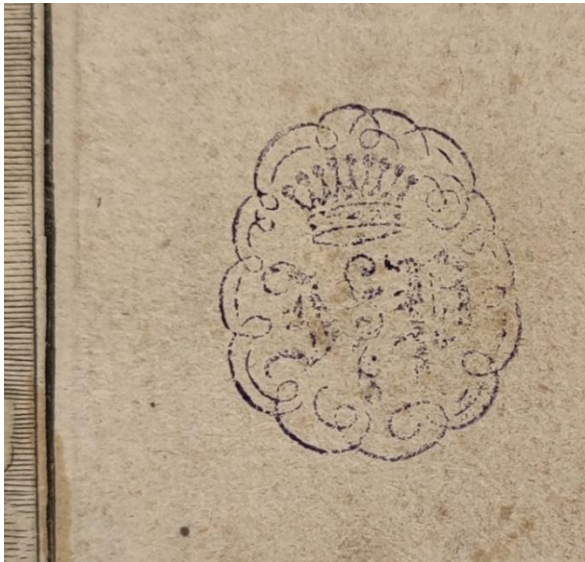
SLIKA 13. Abraham Aubry, Aetas Argentea , verzija iz Grafičke zbirke Nacionalne i sveučilišne knjižnice u Zagrebu, detalj.

S obzirom da zagrebački album počinje scenom koja je numerirana brojem 4, a završava scenom broj 148, jasno je da predmet nije 'cjelovit'. Aubryjevo izdanje Metamorfoza iz Sveučilišne knjižnice Erlangen-Nürnberg nakon dvije naslovnice počinje prikazom naziva RERVUM DISTINCTIO u kojem Ovidije opisuje nastanak svijeta. Slijedi ploča pod brojem dva naziva ANIMANTIBUS HABITENDI LOCUS ASSIGNATUR , iza koje slijedi treća AETAS AUREA , nakon koje dolazi četvrta ploča AETAS ARGENTEA koja se podudara sa zagrebačkim prvim listom u albumu.