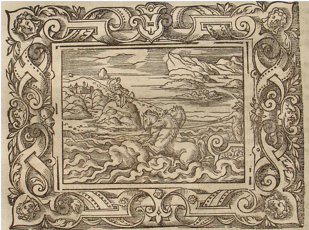
SLIKA 21. Virgil Solis, Kupid strijelom gađa Plutona , drvorez, iz: P. OVIDII METAMORPHOSIS, izdavač Sigmund Feyerabendt, Frankfurt, 1581.

djelomično, no njen prednji dio nosi volutu identičnu volutama s okvira, što je zanimljiv primjer povezivanja vanjske i unutarnje dekoracije grafike. Pluton je prikazan nag te je sjena na njegovim leđima izvedena pomoću kratkih crtica. Venera i Kupid su prikazani izrazito sitni, no strateški izvedenim linijama njihovih malenih figura može se uočiti Venerino naređivanje Kupidu da potajice gađa boga Podzemlja. Solis na ovom drvorezu vrsno definira atmosferu scene dugim, ravnim paralelnim linijama koje su tako oštra suprotnost divljem moru iz kojeg Pluton izlazi.