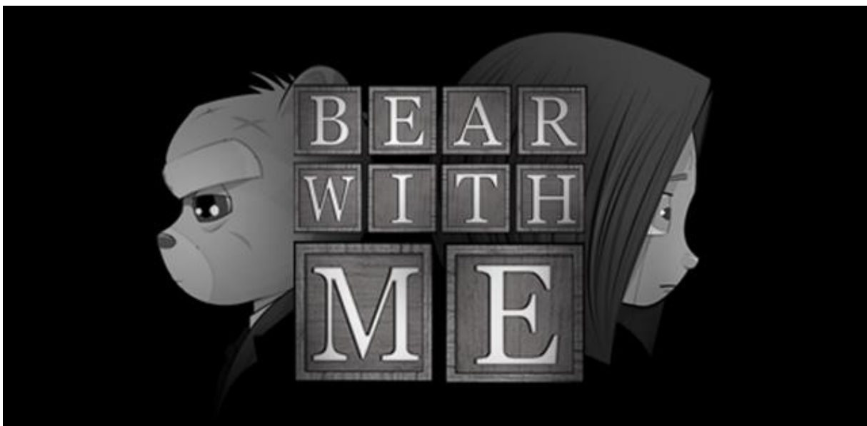
Slika 22. Zaslون učitavanja videoigre „Bear With Me“ poduzeća Exordium Games [57]