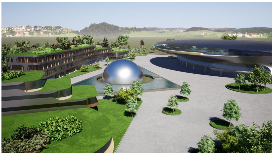
Slika 15. 3D model izgleda kampusa u Novskoj [31]