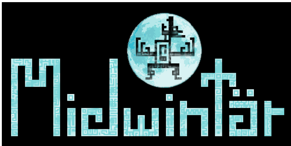
Slika 20. Logotip videoigre „Midwintär” poduzeća Gamechuck [53]

Prvih godinu dana poslovanja Gamechuck-a je izgledalo više kao hobi, nego kao poslovanje, a razlog za ovu misao kažu kako je zato jer nisu zarađivali skoro ništa, nego im je fokus bio više na tome da izgrade nešto za kasnije. Radili su bez stalnih prihoda, a cilj im je bio da oforme željeni studio, osmisle brendiranje, svoju web stranicu, da naprave svoju prvu videoigru i da je plasiraju na tržište. Osim toga, išli su po raznim sajmovima i sličnim događanjima kako bi se predstavili publici i potencijalnim vanjskim suradnicima koji bi im mogli pomoći u ostvarivanju njihovog plana. Tek nakon što su sve svoje početne ciljeve ispunili i