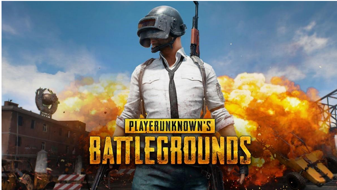
Slika 8. PubG najava [17]

Battle Royal je žanr videoigre koja je akcijska i koja se brzo se odvija, te se i ovdje igrači moraju boriti do smrti. Cilj ovih videoigara je da igrač ostane što dulje u igri i ubije što više drugih sudionika, odnosno ako želi pobijediti treba ostati jedini preživjeli. Ovakvu vrstu može igrati između jednog i najviše četiri natjecatelja u timu. Najpoznatije ovakve videoigre današnjice su Fortnite , PubG i Warzone . [13]