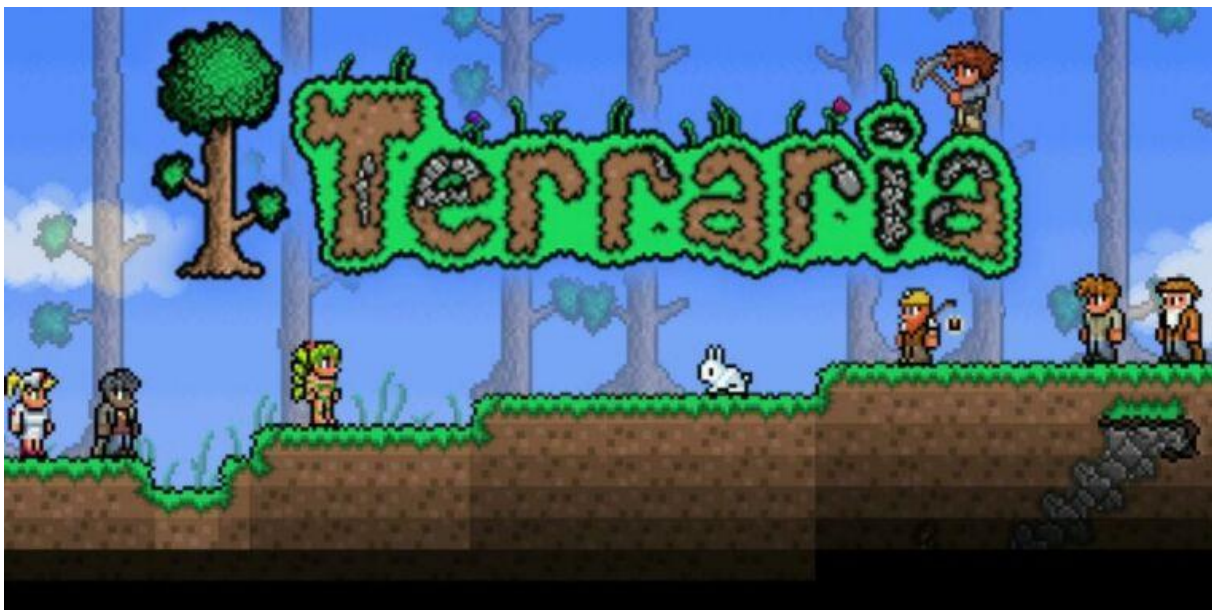
Slika 2. Početni prikaz videoigre Terraria [8]

Iz ranije navedenih ograničenja, prve igre su zapravo bile arkadne igre. Kasnijim razvitkom i unapređenjem računala su se počele razvijati računalne igre u današnjem smislu tih riječi. Prije računalnih igri, još su proizvedene konzole na kojima su se mogle igrati videoigre. Najpoznatije konzole su „ PlayStation “, „ Nintendo “ i „ Xbox “. Tek nakon konzola su se stvorile računalne igre koje su danas najzastupljenije uz mobilne igre.