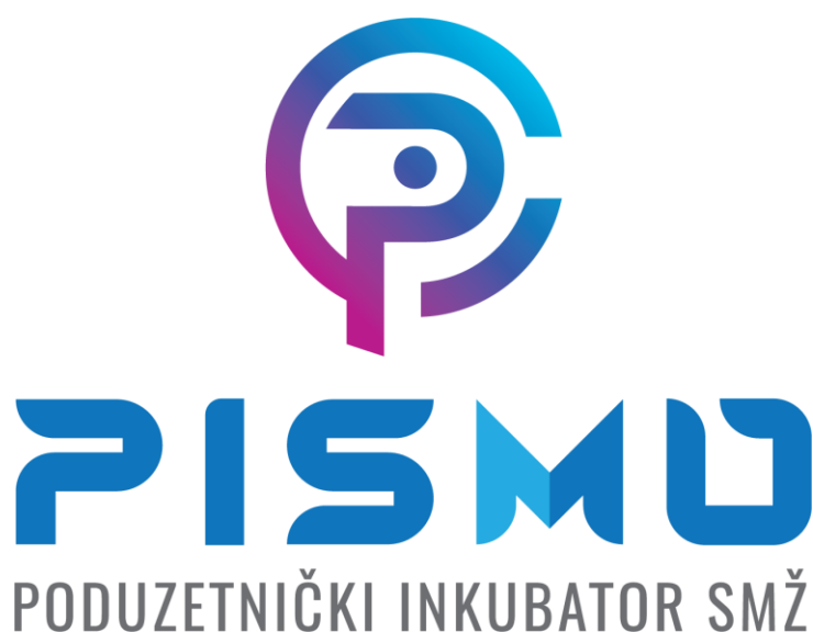
Slika 16. Logotip poduzetničkog inkubatora „PISMO“ [33]

Kao što je ranije rečeno, Novska se jako trudi kako bi unaprijedila razvoj i obrazovanje za industriju videoigara. Osim navedenog projekta, te smjera u srednjoj školi, u Novskoj postoji i poduzetnički inkubator „PISMO“ koji je specijaliziran i iznimno fokusiran na razvoj start-up poduzeća koja se žele baviti videoigrama, te i na edukaciju mladih ljudi vezanih uz ovu industriju. Početkom godine je u ovom inkubatoru bilo preko 67 tvrtki koje su specifično specijalizirane za razvoj i izradu videoigara. Osim toga, u inkubatoru se educiralo oko 300 mladih ljudi koje zanima ovo područje. U ovom inkubatoru je vrlo bitno umrežavanje ljudi i poduzeća koja su u inkubatoru, te se tako vrlo lako povezuju poduzetnici s osobama koje se educiraju u ovom inkubatoru, a to je način na koji nastaje jedna zajednica koja se međusobno nadopunjava. [32]