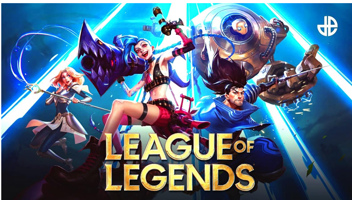
Slika 9. Najava za 12. sezonu videoigre League of Legends [18]

Online borbeno arena za više igrača ili engleski skraćeno MOBA , jest podvrsta strateške videoigre. Tijekom igranja ovakve videoigre, igrač preuzima ulogu jednog lika gdje sa svojim timom strateški pokušava pobijediti suprotni tim, odnosno svoje protivnike. Najpoznatije i najpopularnije igre ovog žanra su League of Legends i Dota 2 . [13]