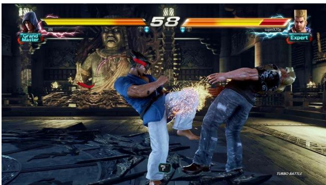
Slika 7. Borci tijekom igranja videoigre Tekken [16]

Borilačke videoigre su videoigre u kojima se dva ili više natjecatelja međusobno bore, odnosno tijekom igranja jedan borac drugoga treba što više puta udariti kako bi mu smanjio indikator životne snage ( eng. health bar ), te tako najviše (i najčešće) u tri runde. Četiri su vrste ovakvih videoigara, odnosno tipova boraca u ovakvim videoigramama, a to su: 2D borci, 3D borci, 5D borci i borci na platformi. Najpoznatiji primjeri ovakvog tipa videoigara su Mortal Combat i Tekken . Na sljedećoj slici se mogu vidjeti 2D borci u videoigri Tekken te se iznad svakog nalazi njegov indikator životne snage. [13]