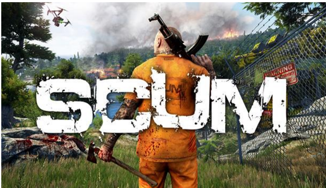
Slika 12. Početni zaslon hrvatske videoigre „SCUM “ [22]

Industrija videoigara u Hrvatskoj je također, kao i u svijetu, jedna od najbrže rastućih industrija. Sam razvoj industrije videoigara u Hrvatskoj započeo je nešto kasnije nego u svijetu, te do sada postoji otprilike 37 godina, što znači da se u Hrvatskoj počela razvijati oko 1985. godine. Prva komercijalna igra koja je nastala u Hrvatskoj bila je „Vruće ljetovanje“, a izdala ju je hrvatska softverska izdavačka kuća Suzy Soft 1985. godine. Pravi početak razvitka industrije se zapravo počeo događati 1993. godine kada je tvrtka Croteam postala pravi studio za razvoj računalnih igara. Croteam je svojim napornim trudom i radom 2001. godine izdao videoigru „ Serious Sam: The First Encounter “ koja je postala popularna, te su od nje odlučili napraviti franšizu, a zadnja serija ove videoigre izdana je 2020. godine. Također, tvrtka koju je bitno za spomenuti je tvrtka Gamepires koja je 2018. godine izdala videoigru „SCUM“, te je ta videoigra jedan od najvećih uspjeha ove industrije na području Hrvatske. [21] Naravno, ovo nisu jedine tvrtke koje su zaslužne za probijanje Hrvatske na tržište industrije videoigara. U Hrvatskoj postoji preko 50 poduzeća i start-up poduzeća koja se bave razvojem videoigara, a za uspjeh mnogih od ovih poduzeća, te trenutni i budući razvoj, zaslužan je inkubator PISMO koji se nalazi u Novskoj.