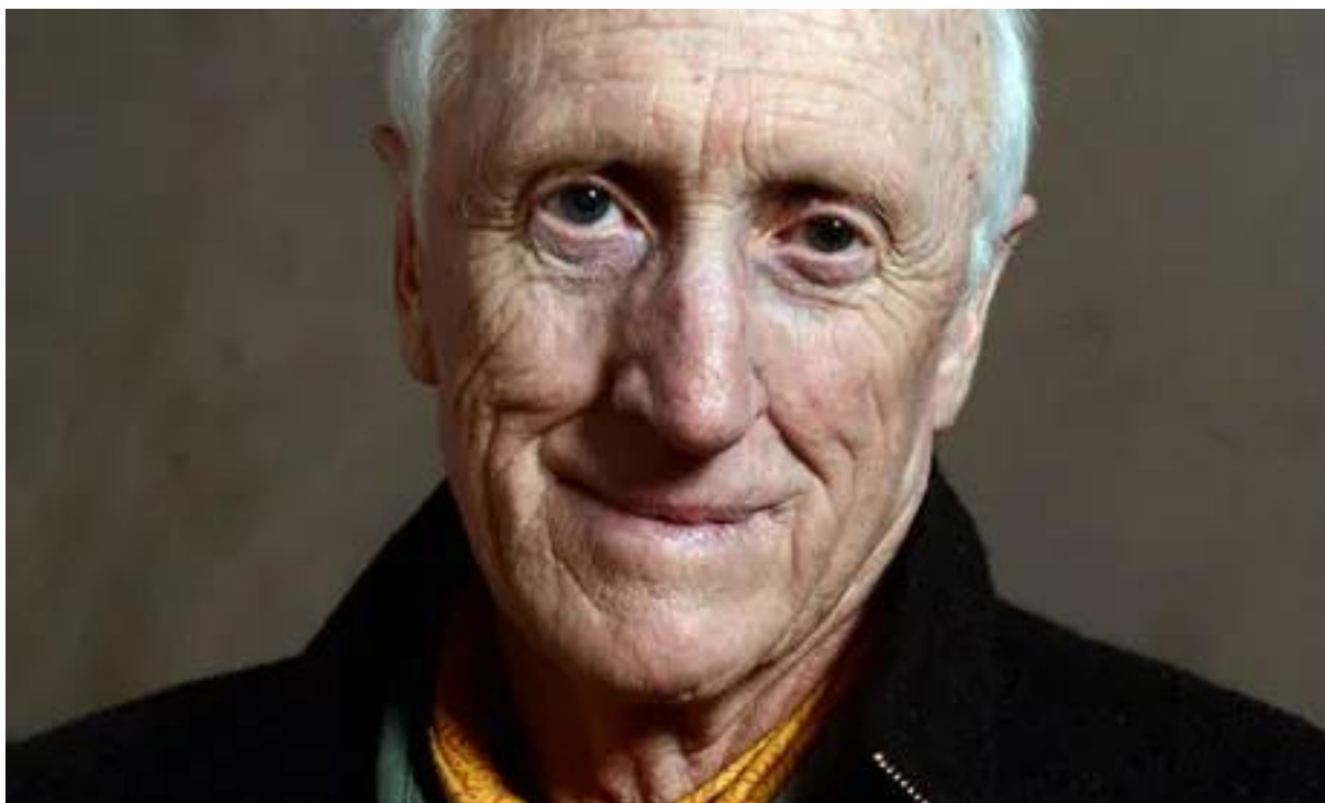
Slika 4. Stewart Brand [12]

Najčešći žanrovi esport videoigara su: pucačina iz prvog lica (eng. First-person shooter (FPS) ), strateške igre u stvarnom vremenu (eng. Real-time strategy (RTS) ), borilačke videoigre (eng. Fighting game community (FGC) ), Battle Royal , online borbena arena za više igrača (eng. Multyplayer online battle arena (MOBA) ), te trkaći i sportski simulatori [10].