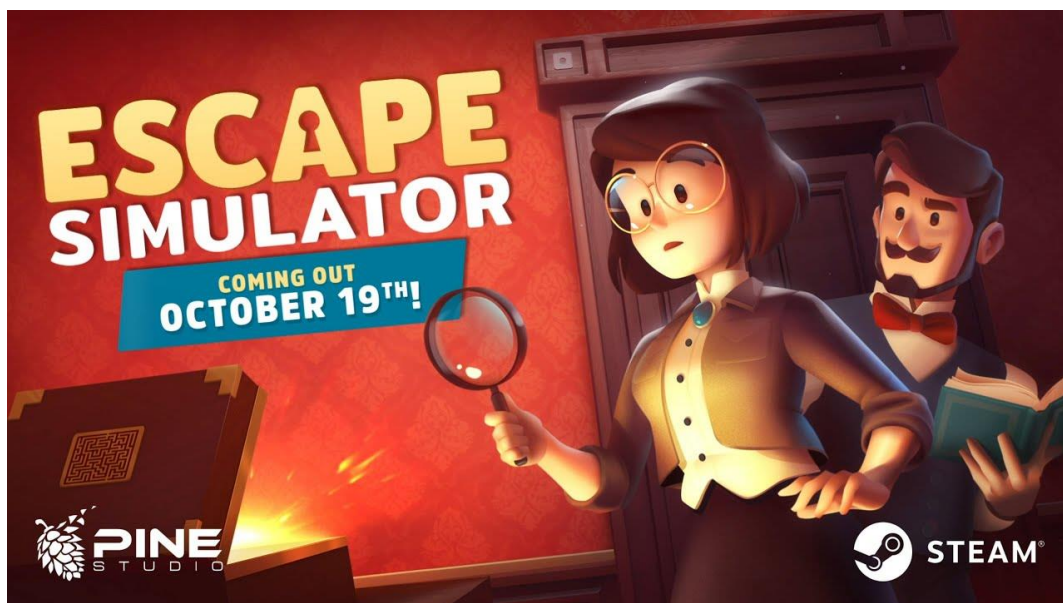
Slika 18. Najava za videoigru „Escape Simulator“ poduzeća Pine Studio [51]

Svaki početak je težak, pa je tako bilo i ovom poduzeću. Poduzeće su otvorila četiri suvlasnika koji su prvih par godina radili kao tim na svojim projektima, a svoj poduzetnički pothvat su započeli u garaži. Sve što su radili, radili su sami, a isključivo su radili za druge izdavače, te videoigre po narudžbi. Na taj način su prikupljali novo znanje i iskustvo. Smjer poslovanja su mijenjali nekoliko puta. Kao što je rečeno, prvo su videoigre radili po narudžbi, nakon toga su počeli proizvoditi svoje videoigre ali su ih izdavali u suradnji sa stranim izdavačima, a danas su toliko napredovali da videoigre koje proizvode sami izdaju. Iako su više puta mijenjali smjer poslovanja, cilj im je uvijek ostao isti: razvijati videoigre koje su njima zanimljive za raditi, ali i za igrati, a pritom da ostanu financijski sigurni.