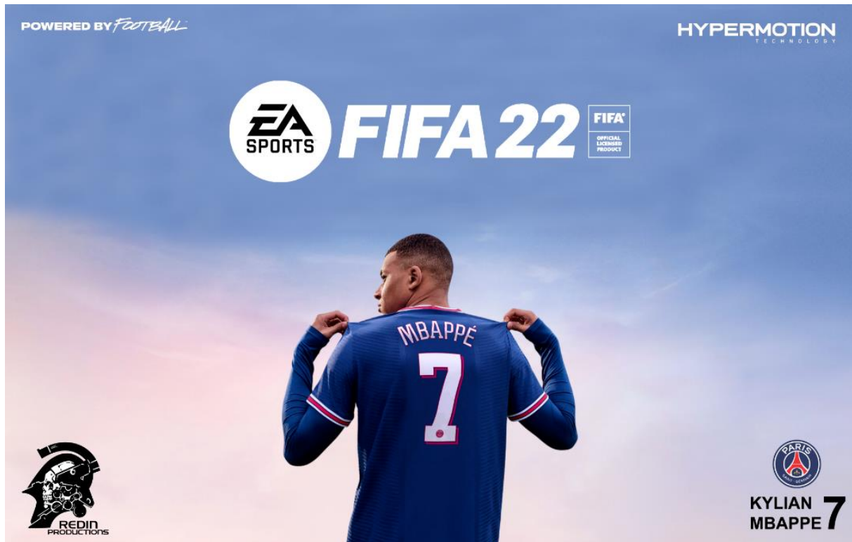
Slika 10. Najava za FIFA-u 22 [19]

Posljednji, ali ne manje važni, žanrovi esporta su trkaći i sportski simulatori. U ovakvim videoigrama cilj je da igrač bude što bolji u što više različitih aspekata videoigre, odnosno da bude što bolji u vožnji različitih vozila ili u igranju u različitim timovima. Najpoznatije igre ovog žanra su FIFA , NBA2K , Rocket League i slične.