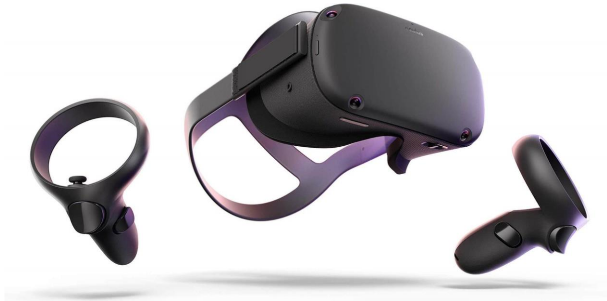
Slika 3. Set za virtualnu realnost [9]

još nije u potpunosti razvijen, nego je u fazi razvitka i istraživanja. Bit ovog oblika videoigri je da igrač ( engl. Gamer ) koristi set za virtualnu realnost koji se najčešće sastoji od posebnih naočala specijaliziranih za ovu vrstu igri, te rukavica ili različitih upravljača koji omogućuju kretnju kroz igru.