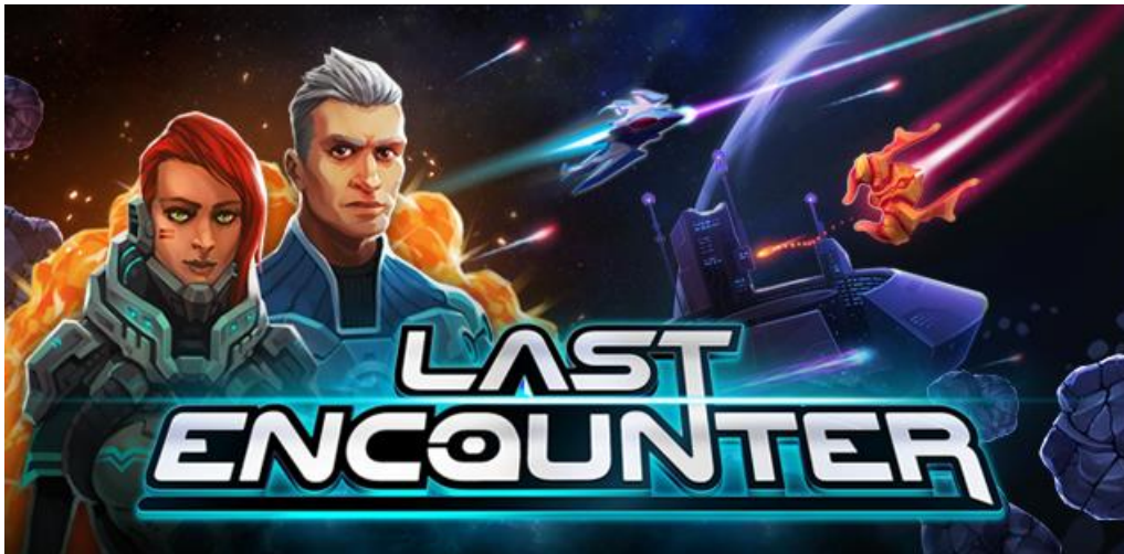
Slika 23. Najava za videoigru „Last Encounter“ poduzeća Exordium Games [58]

Exordium Games je poduzeće koje je osnovano na ulagačkom kapitalu. Ulagački kapital im je omogućio da strategiju gradnje tima započnu i provedu od samog početka. U početku nisu imali nikakvo iskustvo, niti kontakte, klijente ili prihode. Ono što ih je motiviralo da nastave s onim što su započeli je bila velika volja tima mladih i sposobnih ljudi koji su željeli stvarati videoigre. Nekoliko godina kasnije su uspjeli dobiti sve što u početku nisu imali, te su ostvarivali pozitivne poslovne rezultate, razvijali se i rasli, te to nastavljaju i danas. Svoj smjer i cilj poslovanja su mijenjali nekoliko puta. Samo tržište je vrlo dinamično, te nešto što je danas možda funkcioniralo i bilo isplativo, sutra možda više neće biti i neće davati nikakvog efekta. Iz toga razloga je bitno pratiti promjene koje se događaju na tržištu, no isto tako je bitno i imati volju i mogućnost za promjenom unutar tima. Od početka pa do danas, poduzeće je proizvodilo različite igre. Proizvodili su videoigre za konzole i računala, edukativne, mobilne i web videoigre, hyper-casual videoigre, videoigre za proširenu stvarnost, te blockchain videoigre.