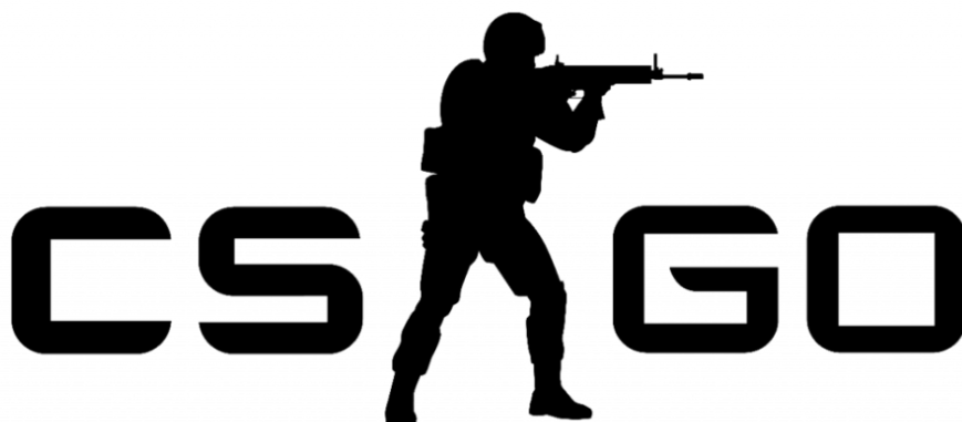
Slika 5. Logotip Counter-Strike: Global Offensive (CS:GO) [14]

FPS, to jest pucačina iz prvog lica, oblik je videoigre gdje igrač igra iz perspektive prvog lica, odnosno ono što vidi je oružje koje drži u rukama i sve ono što se nalazi oko samog lika. Najpoznatije videoigre ovog oblika su Counter-Strike: Global Offensive (CS:GO) , Call of Duty: Warzone , Valorant , Battlefield i druge. [13]