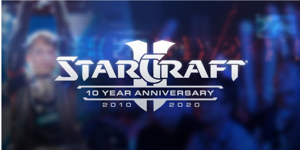
Slika 6. Objava za 10. godišnjicu videoigre StarCraft [15]

Strateške igre u stvarnom vremenu su videoigre za čije igranje je potrebna strategija, odnosno igrač tijekom njihova igranja treba upotrijebiti najbolju moguću strategiju kako bi pobijedio. Najpoznatija strateška videoigra je Civilization , no ona nije i esport igra. Esport strateške igre su StarCraft , Warcraft i Age of Empires . [13]