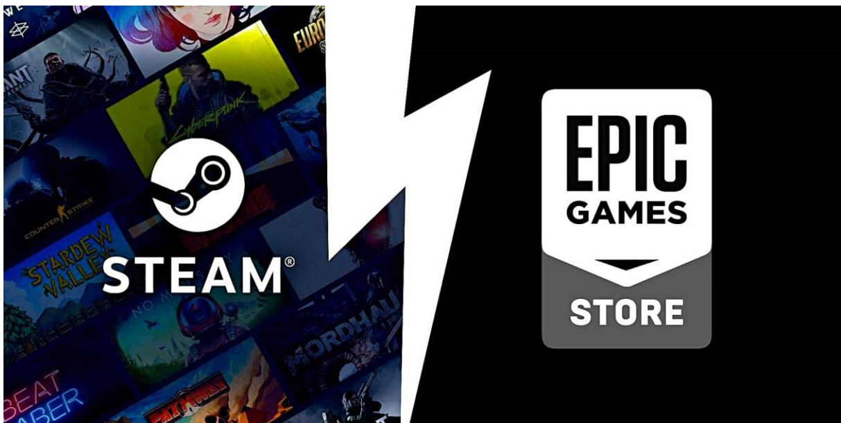
Slika. Logotipi platformi „ Steam “ i „ Epic Games “ [46]

Mnogi zaključuju kako je sada najbolje vrijeme za ući u ovu industriju u bilo kojem smislu, ali pogotovo u poduzetničkom smislu. Davor Hunski iz Croteam-a kaže kako nikada nije bilo lakše distribuirati videoigru na tržište nego sada. Mnoge tvrtke koje se bave industrijom videoigara, kada izrade svoju videoigru, postavljaju je na platformu „ Steam “. Proces se odvija tako da neka tvrtka napravi svoju videoigru, pošalje je na testiranje i odobravanje, te kada prođe oboje, ona se postavlja na Steam tržište koje čini preko 125 milijuna korisnika. Na taj način se promovira mnogo tvrtki i njihovih videoigara, te na taj način i zarađuju velike prihode. Naravno, Steam nije jedina takva platforma. Jedna od jačih i sličnih platformi je Epic Games koja je postala najbolja i najnovija alternativa za Steam . [43], [45]