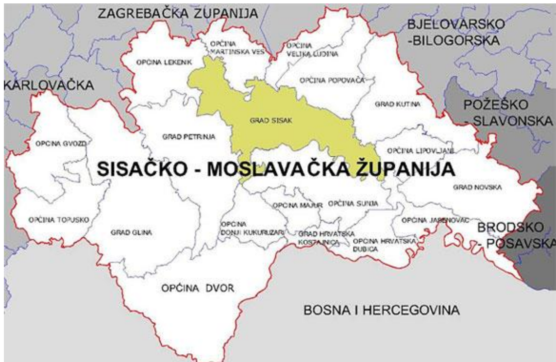
Slika 1. Položaj Sisačko-moslavačke županije, [5]

Na slici 1 prikazan je položaj Sisačko-moslavačke županije zajedno sa gradovima i općinama koje ju čine.