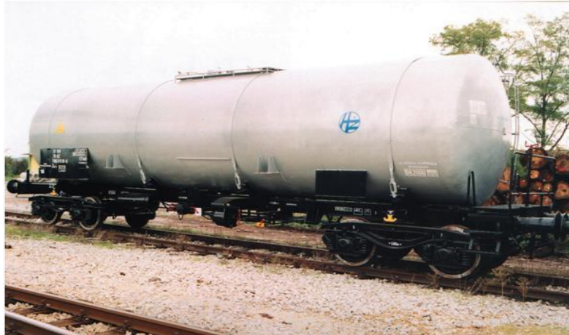
Slika 6.: Vagon serije Z, podserije Zas

Serijski vagoni Z s podserijama (Zas, Zaes, Zagkks, ..) su specijalni zatvoreni vagoni s posudama za tekućine-cisterne, namijenjeni su za prijevoz tekućina bez ambalaže te onih tvari koje na povišenoj temperaturi prelaze u tekuće stanje (mazut, bitumen, parafin i slično). Na vagonima je označeno za koju su tekućinu namijenjeni. To je potrebno zbog toga da se spremnici vagona ne moraju prati ako se njima prevozi ista vrsta tekućine. 2 Izvode se kao dvoosovinski i četveroosovinski.