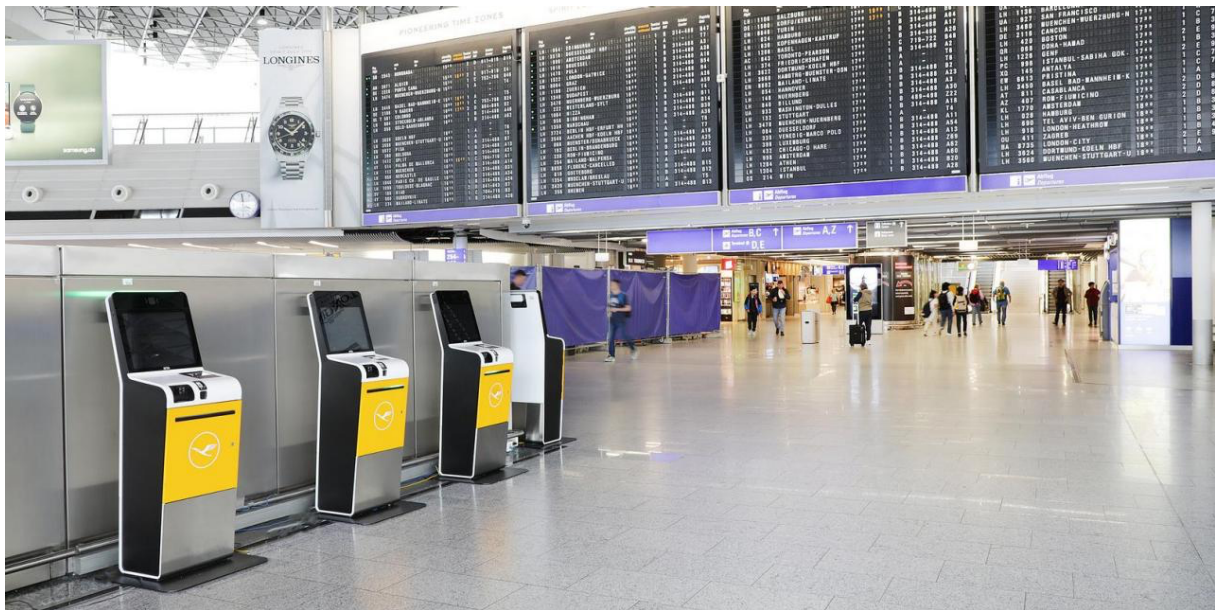
Slika 1. Samouslužni kiosk za prijavu na let, Zračna luka Frankfurt [16]