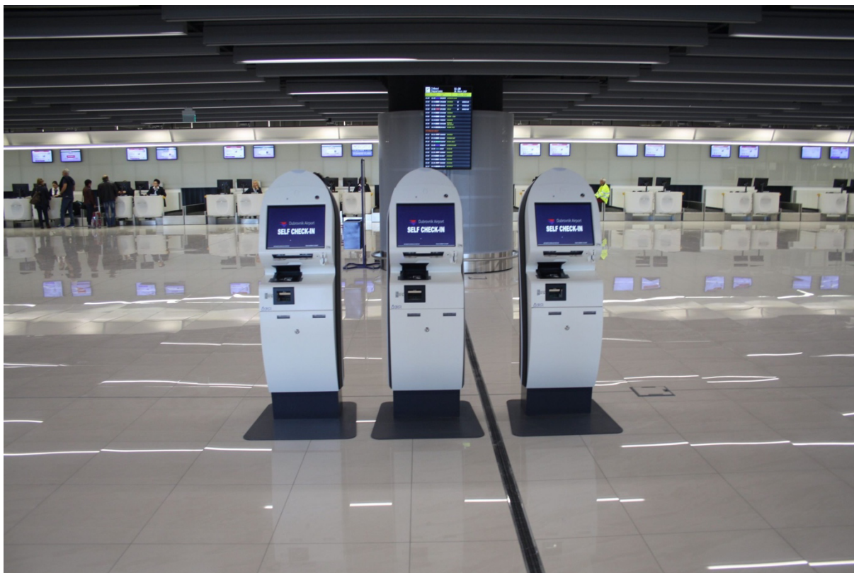
Slika 3. Samouslužni kiosk za prijavu na let na Zračnoj luci Dubrovnik [35]