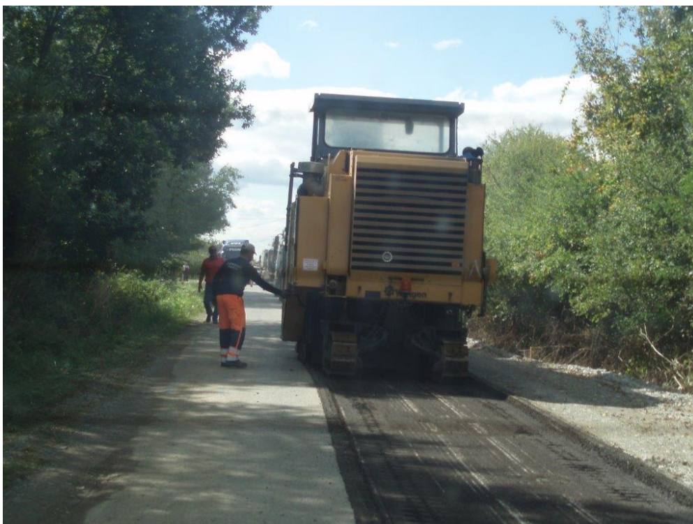
Slika 4. Obnova kolničkog zastora

Ovisno o svojim značajkama, radovi održavanja razvrstavaju se u sljedeće osnovne skupine [17]: