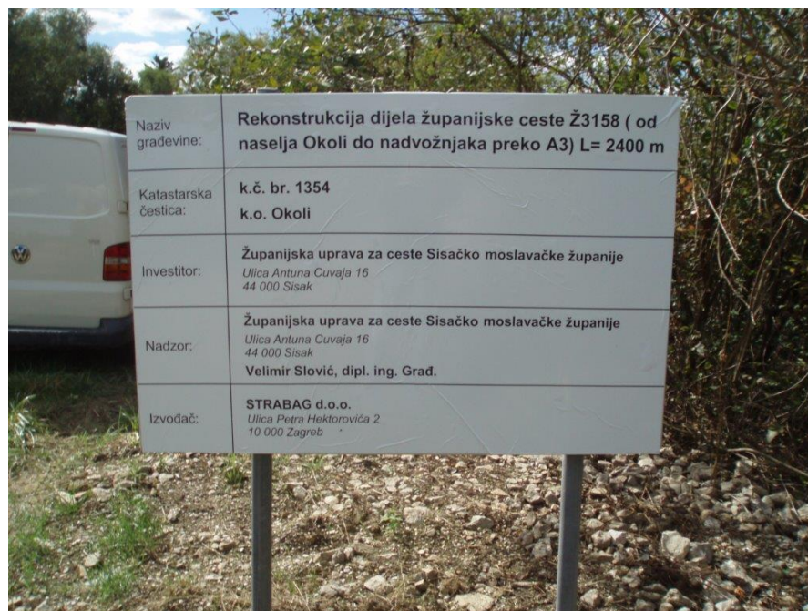
Slika 6. Rekonstrukcija županijske ceste Ž3158, proširenje kolnika