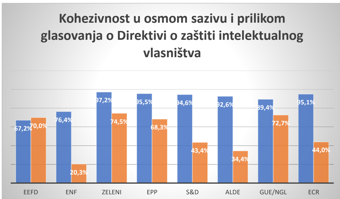
Graf 5 Usporedba kohezije u osmom sazivu sa kohezijom prilikom glasovanja o Direktivi o zaštiti intelektualnog vlasništva

70%, dok kod ENF-a iznosi svega 20, ALDE-a 34 te Socijalista 43 posto. Ako iz ovih rezultata izračunamo prosjek kohezivnosti samih grupacija, rezultati nam pokazuju kako je prosječna kohezivnost iznosila 53,5 posto. U Grafu 1 grafički je napravljena usporedba kohezivnosti političkih grupacija u osmom sazivu sa kohezijom grupacija kod ovog specifičnog glasovanja. Jasno je vidljiv pad kohezije svih europskih grupacija osim EEFD-a gdje je kohezija kod glasovanja narasla za nešto manje od tri postotna boda. Na temelju ovih rezultata dalo bi se zaključiti kako je uloga političke grupacije bila mala, te nije bila odlučujući faktor prilikom odluke zastupnika o glasovanju na plenarnoj sjednici (term8.votewatch.eu, 2020).