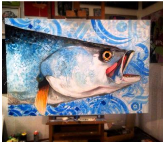
Slika 5 Crtež ribe u atelje Lapo Lapo – autor Modul8

Važan segment jesu i brojni festivali. I dok se po svijetu događa, u gotovo svim većim gradovima događaju grafiti festivali, oni su također u manjku, u Zagrebačkom slučaju. Nea je izašla sa svojih osamnaest godina sa grafiti scene ali smatra kako joj je povratku na scenu omogućilo pokretanje poznatog regionalnog grafiti festivala na otoku Braču, Grafiti na Gradele. Za potrebe izložbe koja je održana u Sivoj galeriji povodom nadolazećeg festivala, a u organizaciji „Nie“, Modul 8 naslikao je ribu, koja upravo simbolizira Grafite na gradelama.