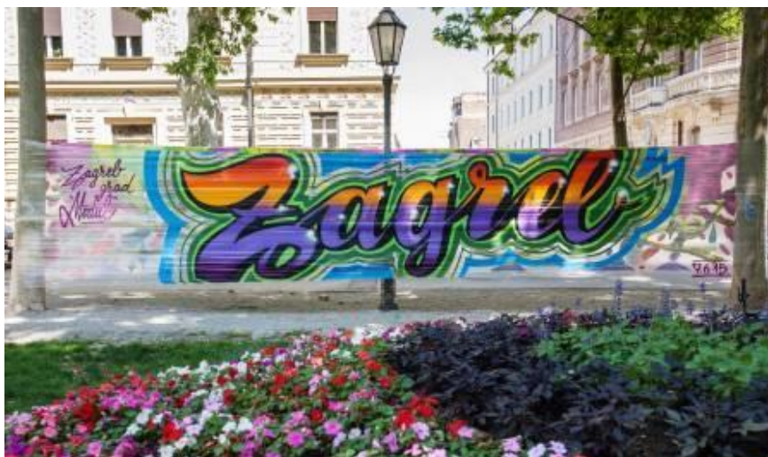
Slika 9: „Zagreb“ – vrsta grafita - freestyle - Modul 8 – lokacija: Park Zrinjevac, Zagreb