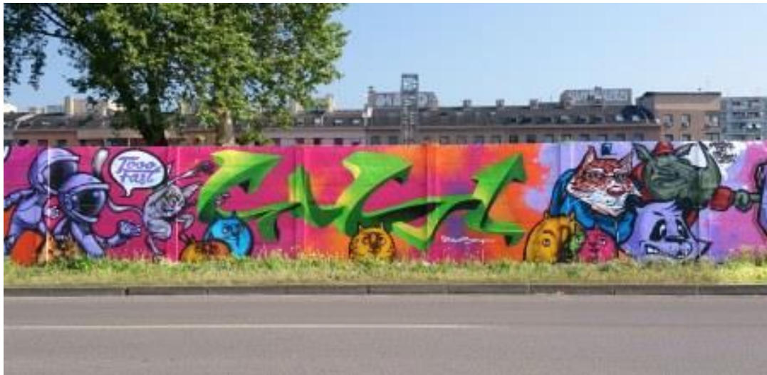
Slika 7 Characters– Branimirova ulica - autor 2Fast