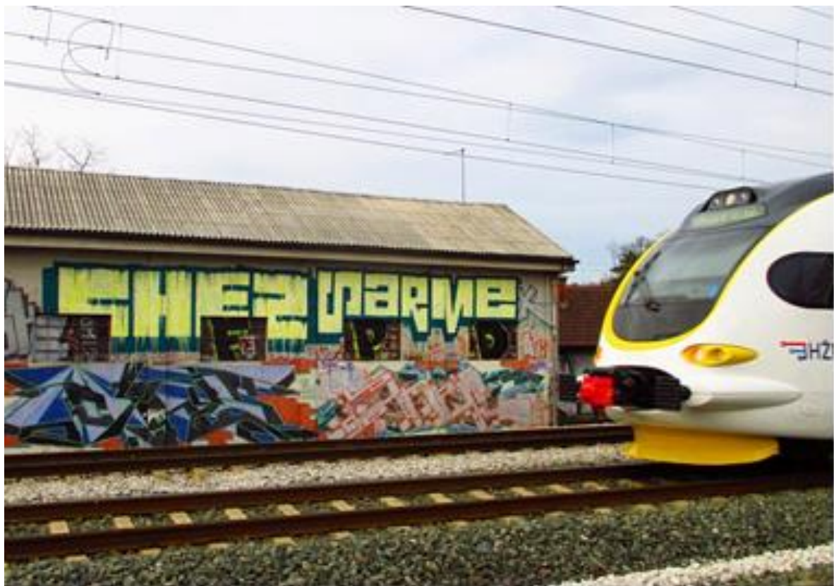
Slika 6 Back to back grafiti kod Zapadnog kolodvora – Chez186

S pravom ili zbog zatvorenosti ove kontrakulture kao što je vidljivo je nemoguće je u potpunosti objasniti zašto se u konačnici crtaju grafiti po ulicama, kada oni nisu razumljivi široj publici. No, ipak Lunar smatra kako njegovi grafiti „kompleksniji, profinjeniji, kompliciraniji i osmišljeniji jer želi da oni budu primjenjivi na sve, odnosno na neke univerzalnim ljudskim problemima, univerzalnim ljudskim minusima i plusevima“, što je jedan od novih načina dolaženja do samih publika.