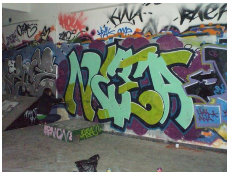
Slika 3 Niein tag u jednom od zagrebačkih pothodnika. Autorica „Nea“

Osim ove teze, grafite je moguće smjestiti u širi kontekst, točnije u street art. Govoreći o povezanosti grafita sa street artom i muralima, treba istaknuti i to kako obični ljudi često ne prave razliku između njih. S toga se često može pronaći definicije, koje isprepliću značenja ova dva naizgled slična pojma. Tim Sieber piše u svome tekstu „ The Neighborhood Strikes Back: Community Murals by Youth in Boston’s Communities of Color“ kako su murali „fundamentalni kolektiv, ali ne i pojedinačni tip umjetnosti (Sieber, 2012:4). Matija Kralj, diplomirani umjetnik Novih medija s Likovne akademije u Zagrebu, u jednom intervjuu vezanom upravo za murale izjavio je kako za njega oni predstavljaju „oslikavanje zidova na javnoj ili zatvorenoj površini zida“ (Osobni intervju, 2015). Takvo što se može vidjeti i na slici broj, 3 autorice Niece, koja je svoj grafit nacrtala u jednom od zagrebačkih pothodnika.