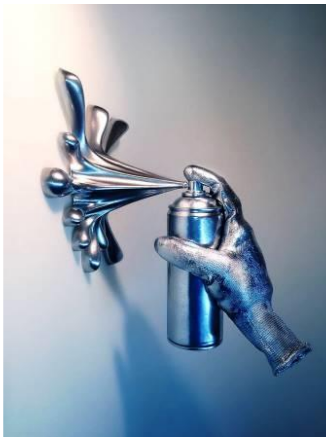
Slika 10 Umjetnička instalacija – lokacija nepoznata – autor 2Fast

U slaganju rječnika grafiti umjetistu, najviše sam se služio knjigom „Subway art“, koja je još od svoga nastanka, ali tako i danas ostala nezaobilazna literatura, kada se govori o grafitima općenito. Također, neki od novih pojmova, preuzeti su sa specijaliziranih blogova, koji se bave proučavanjem grafiti umjetnosti.