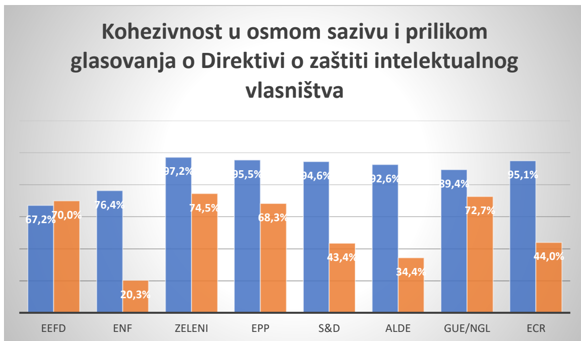
Graf 5 Usporedba kohezije u osmom sazivu sa kohezijom prilikom glasovanja o Direktivi o zaštiti intelektualnog vlasništva

70%, dok kod ENF-a iznosi svega 20, ALDE-a 34 te Socijalista 43 posto. Ako iz ovih rezultata izračunamo prosjek kohezivnosti samih grupacija, rezultati nam pokazuju kako je prosječna kohezivnost iznosila 53,5 posto. U Grafu 1 grafički je napravljena usporedba kohezivnosti političkih grupacija u osmom sazivu sa kohezijom grupacija kod ovog specifičnog glasovanja. Jasno je vidljiv pad kohezije svih europskih grupacija osim EEFD-a gdje je kohezija kod glasovanja narasla za nešto manje od tri postotna boda. Na temelju ovih rezultata dalo bi se zaključiti kako je uloga političke grupacije bila mala, te nije bila odlučujući faktor prilikom odluke zastupnika o glasovanju na plenarnoj sjednici (term8.votewatch.eu, 2020).