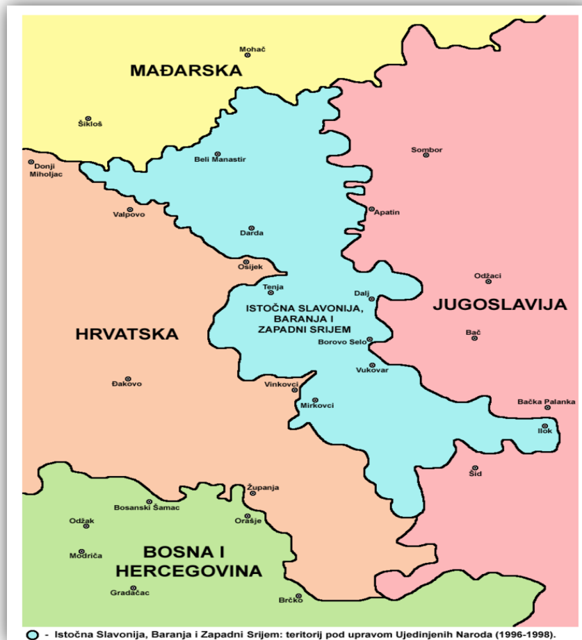
Slika 3: Područje hrvatskog Podunavlja (istočna Slavonija, Baranja i zapadni Srijem)