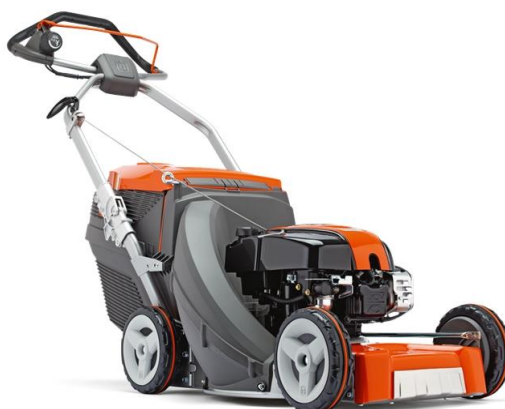
Slika 7.11 Kosilica za domaćinstvo.

Najčešći pogon korištena u kosilicama u domaćinstvu su dvotaktni i četverotaktni motori s vanjskim izvorom paljenja. Snage motora kreću se od 1 kW do 10 kW. Zapremnina motora se kreće od 100 kubičnih centimetara do 250 kubičnih centimetara. Prema [4].