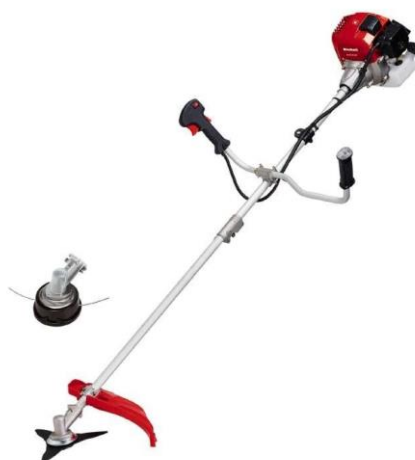
Slika 7.12 Trimer korišten u domaćinstvu.

Uglavnom pogonjeni dvotaktnim motorima s vanjskim izvorom paljenja, a snage im se kreću od 0,25 kW do 1,4 kW. Prema [4].