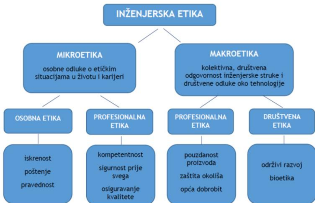
Slika 3: Sumarni i slikoviti prikaz inženjerske etike [3]

Inženjerska etika može se razmatrati na više razina i s više različitih gledišta (slika 3).