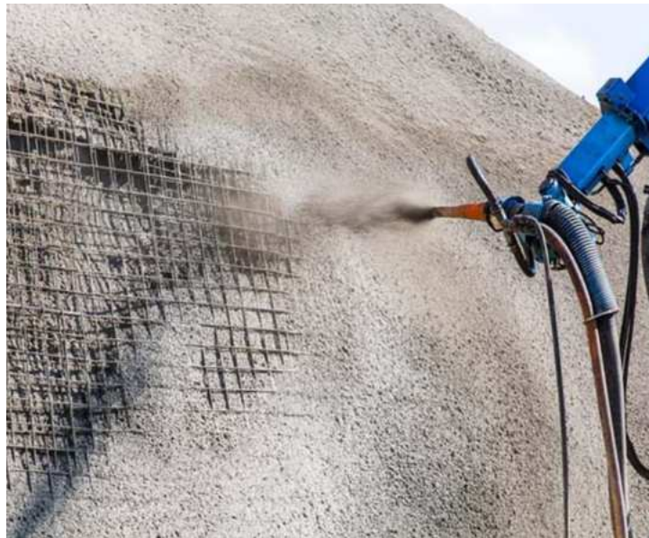
Slika 23.: Mlazni beton [23]