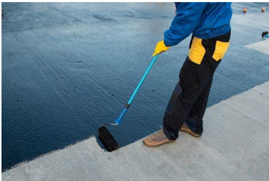
Slika 1.: Bitumenska boja [1]

Bitumenska boja je fleksibilnog tipa i nanosi se valjcima ili četkama. Predviđena je za veće površine u obliku završnog sloja i osnovnog premaza za membranu. [5]