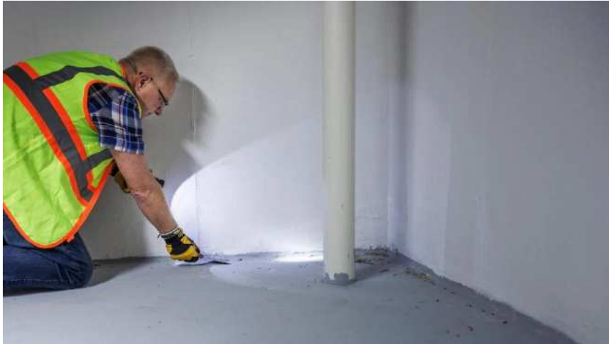
Slika 13.: Vizualna inspekcija [13]