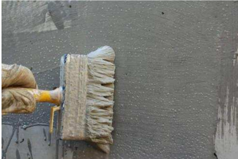
Slika 3.: Cementni premaz [3]