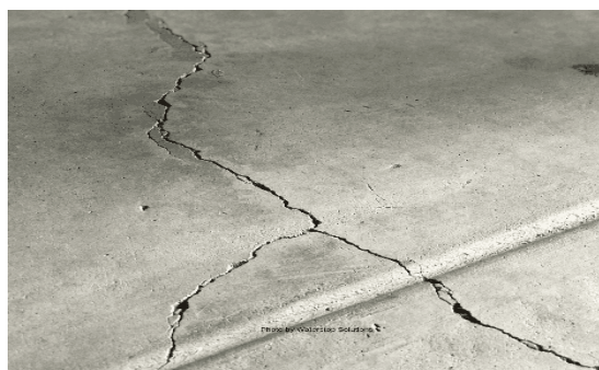
Slika 9.: Pukotine u betonu [9]

Treba voditi računa o pravilnoj ugradnji samog betona kako bi se kvalitetno stvrdnuo i smanjio rizik od stvaranja od pukotina. U protivnom, hidroizolacija će biti neuspješna i trebat će ju sanirati. [1]