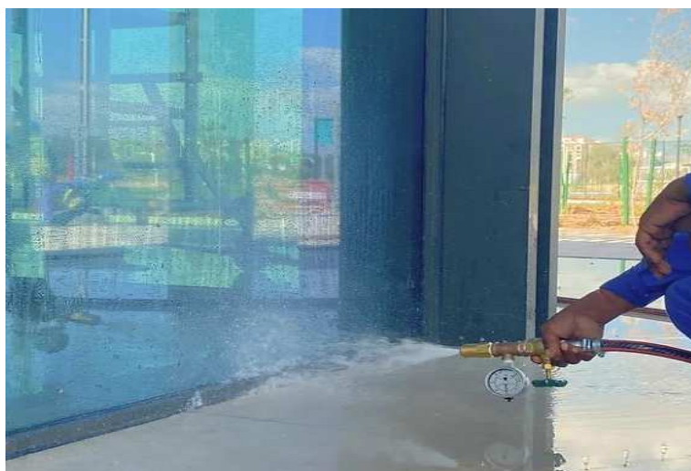
Slika 14.: Testiranje fasade vodom [14]

Testiranje vodom je jedna od češćih metoda koja se koristi u praksi. Voda se postupno primjenjuje na dijelove zgrade kako bi se utvrdilo događa li se igdje curenje ili upijanje vode. Njome se otkrivaju mjesta curenja, ali ne i uzrok.