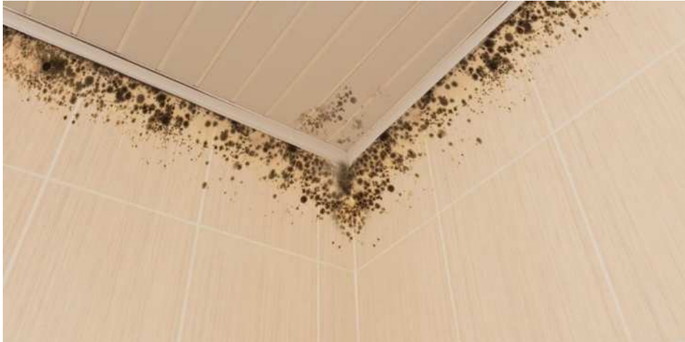
Slika 11.: Plijesan u kupaonici [11]