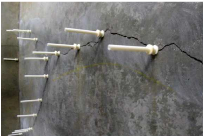
Slika 21.: Injektiranje epoksidnom smolom [21]

Proces ubrizgavanja provodi se pritiskanjem smole kroz otvore pukotine, a ako je riječ o većim pukotinama, otvori se buše i koriste se posebni uređaji koji osiguravaju kvalitetnu ispunu pukotine. Injektiranje kreće od najnižih otvora. Ovisno o karakteristikama same pukotine, curenje epoksida mora se spriječiti sa odgovarajućih strana elementa, drugim riječima, mora se pažljivo kontrolirati sveukupni proces ubrizgavanja.