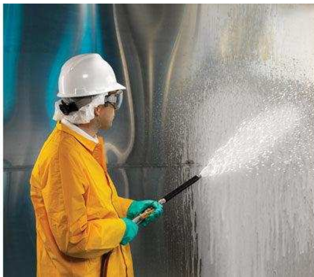
Slika 17.: Kemijsko čišćenje [17]