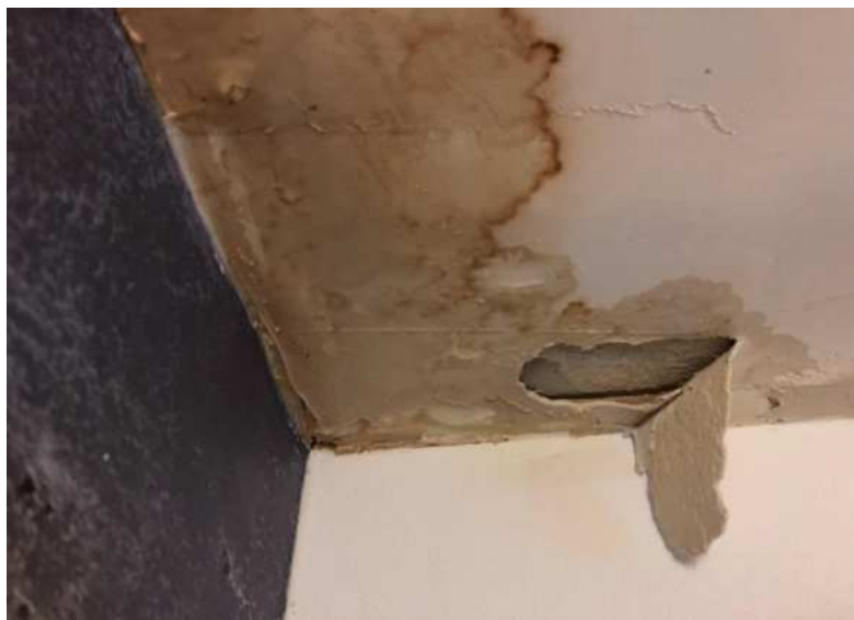
Slika 10.: Oštećenje konstrukcije od vlage

Bilo da se radi o drvenoj, betonskoj ili metalnoj konstrukciji, dugoročni utjecaj vlage uništava njezine dijelove. Elementi koji su napadnuti mogu biti nosivi čime se ugrožava i sama stabilnost konstrukcije. Što se kasnije reagira na problem, to troškovi sve više i više rastu. A popravci te vrste, koji uključuju potpunu sanaciju ili zamjenu pojedinih elemenata, mogu biti osjetno skupi.