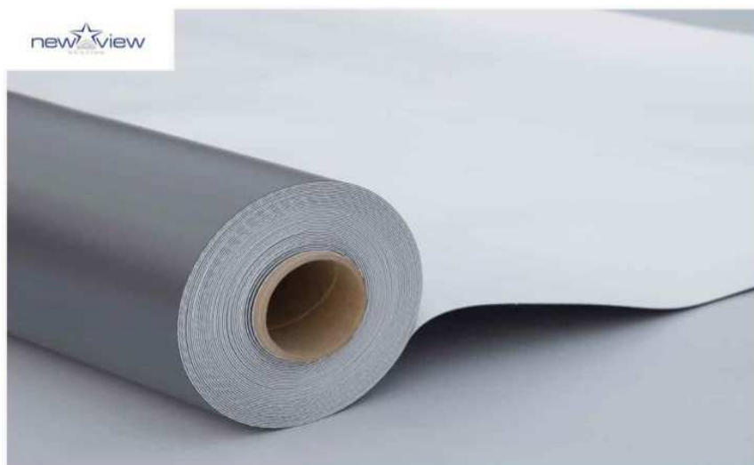
Slika 4.: PVC membrana[4]

PVC membrane ili membrane od polivinil klorida izrađuju se od PVC smole s dodatkom plastifikatora, UV stabilizatora i drugim aditiva. Lako se postavlja i dužeg je vijeka trajanja u odnosu na ostale proizvode (preko 20 godina za krovove, a 50 godina za podzemne prostore).