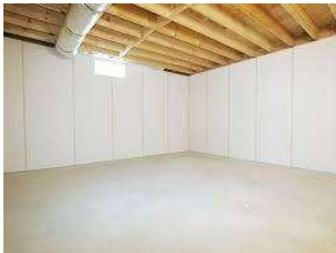
Slika 26.: Zidni paneli za odvodnju vode [26]

Još jedno rješenje koje se pokazalo učinkovitim su zidni paneli koji ostvaruju kanale za odvodnju infiltrirane vode. Voda se slijeva niz panele i akumulira u podnožju zida gdje se nalazi drenažni sustav.