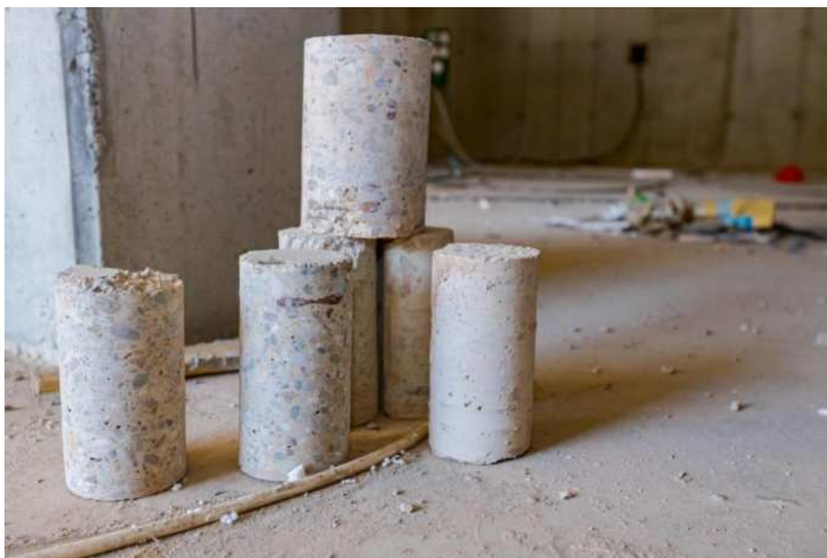
Slika 15.: Uzimanje uzoraka betona [15]

U slučajevima u kojim se uzrok ili ozbiljnost oštećenja ne može odrediti vizualnim ili nerazornim postupkom, morat će se ipak ukloniti dijelovi elemenata za koje se smatra da su kritični. Uzimaju se uzorci tipa jezgra, dijelovi zidova oko prozora ili dijelovi žbuke. Izdvojeni uzorci idu u laboratorij na daljnju analizu. Najčešće se ispituju tlačne ili vlačne čvrstoće materijala, ali provode se i kemijske analize kao i provjera uzorka na nepoželjne sastojke (kao kloride ili sulfite).