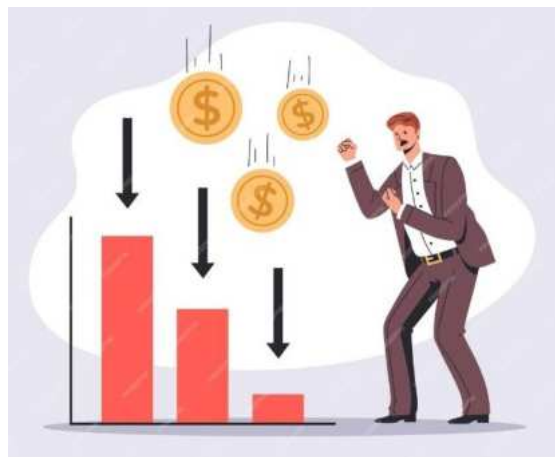
Slika 12.: Ilustracija pada vrijednosti [12]

Neriješene štete od vlage dodatno otežavaju sam proces prodaje. Ako se problemi zanemaruju, na kraju krajeva sama vrijednost nekretnine pada. Troškovi popravaka rastu i onda padaju u ruke kupcima. Dakle, kao što je već napomenuto, prisutnost vode u unutrašnjosti konstrukcije te njeno ignoriranje dovodi do rastućih troškova i nimalo nije ekonomski isplativo. [10]