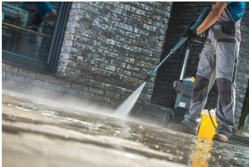
Slika 16.: Čišćenje vodom pod pritiskom [16]

Od štete najsigurnija metoda je natapanje vodom. Njome se stvara konstantan sloj vode na fasadi zgrade te nakon perioda natapanja, uklanja se pod pritiskom. Ipak, glavna mana ovog postupka je što se radi o velikim količinama vode koja može prodrijeti unutar fasade i opet stvoriti dodatne probleme. Namakanje vodom je dugotrajan proces jer naknadno sušenje fasade može potrajati tjednima.