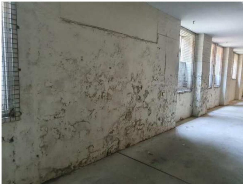
Slika 7.: Posljedice neodržavanja

Čak i manja curenja ili pukotine ne treba zanemariti jer mogu dovesti do značajnih posljedica uslijed širenja vode kroz kritične dijelove konstrukcije. Redovito održavanje brtve na prozorima i vratima ima isto tako veću važnost. Ako se bilo kakav defekt uoči ne smije se zanemariti i treba se prijaviti stručnim osobama kako bi se sanirao na ispravan način. [11]