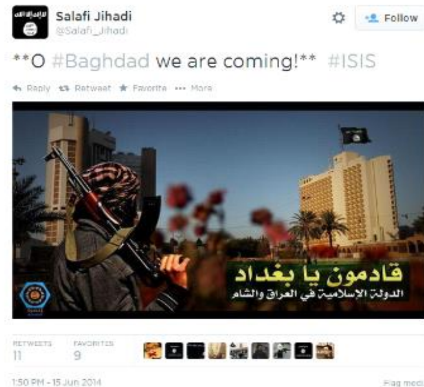
Slika 1. Hashtag kampanja za vrijeme napada Islamske države na grad Mosul

na arapskom podrazumijeva „one marljive“. Uz pomoć njih radikalni islamisti uspješno su provodili svoju strategiju na društvenim mrežama. U kratkom roku uspjeli su objaviti velik broj hashtagova (#) koji su ubrzo postali trend, a priča se potom pretvorila u kampanju. Upravo je uz pomoć tih kampanji Islamska država uspijevala zastrašiti vanjske promatrače, ali i privući potencijalne borce (Berger, Morgan, 2015: 29). Tako je u lipnju 2014., za vrijeme napada na irački grad Mosul, uz pomoć aplikacije Dawn objavljeno gotovo 40 tisuća tweetova . Također, velik broj korisnika aplikacije počeo je objavljivati slike naoružanih džihadista koji gledaju prema zastavi Islamske države, a u kojima je pisalo “ We are coming Baghdad ”. Svatko tko je u tom trenutku u tražilicu upisao „Baghdad“ pojavila se slika kampanje (Slika 1) 4 (Berger, 2014).