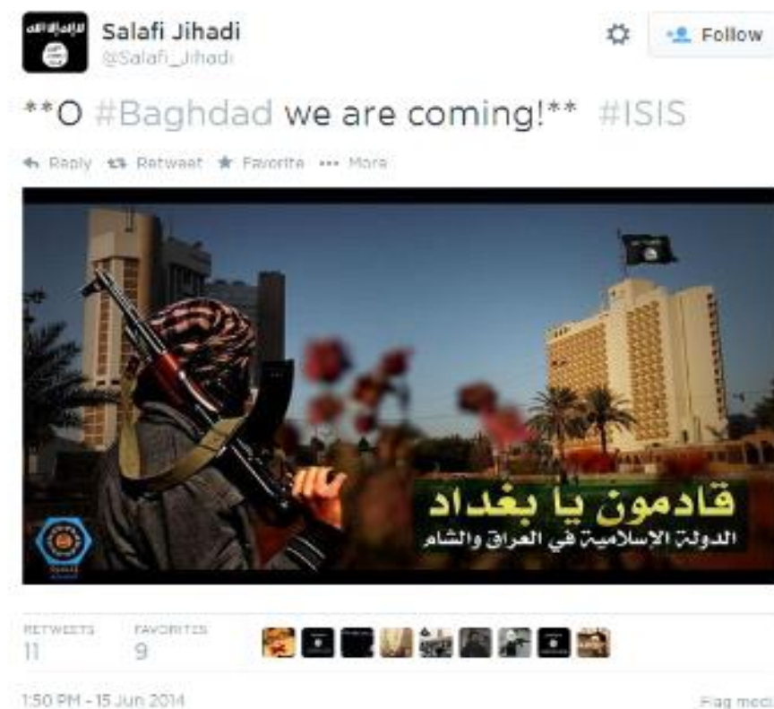
Slika 1. Hashtag kampanja za vrijeme napada Islamske države na grad Mosul

na arapskom podrazumijeva „one marljive“. Uz pomoć njih radikalni islamisti uspješno su provodili svoju strategiju na društvenim mrežama. U kratkom roku uspjeli su objaviti velik broj hashtagova (#) koji su ubrzo postali trend, a priča se potom pretvorila u kampanju. Upravo je uz pomoć tih kampanji Islamska država uspijevala zastrašiti vanjske promatrače, ali i privući potencijalne borce (Berger, Morgan, 2015: 29). Tako je u lipnju 2014., za vrijeme napada na irački grad Mosul, uz pomoć aplikacije Dawn objavljeno gotovo 40 tisuća tweetova . Također, velik broj korisnika aplikacije počeo je objavljivati slike naoružanih džihadista koji gledaju prema zastavi Islamske države, a u kojima je pisalo “ We are coming Baghdad ”. Svatko tko je u tom trenutku u tražilicu upisao „Baghdad“ pojavila se slika kampanje (Slika 1) 4 (Berger, 2014).