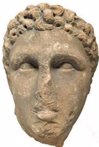
Slika 7. Ptolemej Apion

Njega nasljeđuju Ptolemej VI. Filometor (180. – 145. g. pr. Kr.), Ptolemej VIII. Euerget II. (170. – 116. g. pr. Kr.) i Kleopatra II. (132. – 130. g. pr. Kr., 124. – 116. g. pr. Kr.). 36 Njihove vladavine su opterećene neprestanim dinastičkim sukobima. 37 U jednom trenutku cijeli Egipat, osim Aleksandrije, bit će u rukama Antioha IV. iz dinastije Seleukida, koji se nakon intervencije rimskog senata povlači. 38 Libija i Cipar od tog vremena više nisu pod direktnom kontrolom Egipta, već se često nalaze pod upravom prognanih Ptolemejevića. 39 Slabi mir se postiže oko 124. g. pr. Kr., kada Ptolemej VIII. i Kleopatra III. (116. – 101. g. pr. Kr.) prekidaju rat sa Kleopatrom II. te oni svi počinju zajedno vladati. 40