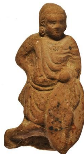
Slika 12. Vojnik naslonjen na galski štit

„domaći“ se podrazumijevalo konjanike koji su imali svoja zemljišta na području Egipta (većinom u nomama Fajum i Oksirink). 138 Oni su uglavnom dolazili iz Makedonije i drugih dijelova Grčke, a zemlja im je bila dodijeljena u zamjenu za vojnu službu. 139 Temelj vojske su sačinjavali teški pješaci čiji je sastav bio osobito mješovit. Osim kraljevske straže, falanga, Libijaca i najamnika iz Grčke također je bio prisutan i znatan broj Egipćana (koji su po prvi put bili teško oklopljeni). 140 Ptolemej I. već uvodi Egipćane u svoju vojsku (u bitki kod Gaze 312. g. pr. Kr.), ali tada nisu imali izraženu ulogu ili čak dostatnu opremu. 141 Treću skupinu kod Rafije su činili laki pješaci iz Krete, Trakije i Galacije. Kelti iz Galacije su često služili kao najamni vojnici na području istočnoga Sredozemlja te su se neki čak naselili u Egiptu. 142 Slonovi su dio egipatske vojske od vladavine Ptolemeja I. koji je prve slonove nabavio od poraženih neprijatelja. 143 Treba napomenuti da su egipatski slonovi (šumski slonovi) kod Rafije bili slabiji (manji) od onih indijskih koje su Seleukidi imali na raspolaganju. 144