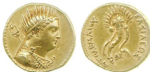
Slika 9. Ptolemej IV.

Proizvodnja kovanica nije bila novost na području Egipta. Nakon što je Psametik I. (664. – 610. g. pr. Kr.) dao dopuštenje Grcima iz Mileta da osnuju grad Naukratij, tamo se ubrzo pojavljuje kovnica novca. 100 U helenističkom periodu vladari su kovali vlastiti novac s izraženim grčkim stilom i natpisima. 101