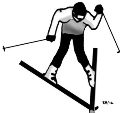
Slika 3. Mehanizam ozljede hiperekstenzija - unutarnja rotacija

Kombinacija hiperekstenzije i unutarnje rotacije (6) učestalo se događa na dubljem i teže prohodnijem snijegu. Ovi uvjeti dovode do iznenadnog zastoja kretanja skija što dovodi do toga da se noge momentalno zaustavljaju dok se gornji dio tijela još kreće kratko naprijed. Ovaj mehanizam se često naglašava kada se radi o neočekivanom križanju vrhova skija stvarajući pokrete unutarnje rotacije i varus silu na koljeno. Rezultat je obično ozljeda prednjeg križnog ligamenta te ponekada oštećenje lateralnih struktura koljena (25).