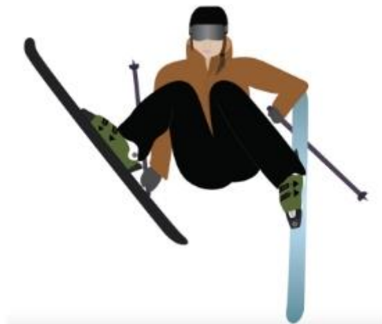
Slika 1 Fantomsko stopalo skijaša

Ranije je već navedeno "fantomsko stopalo" kao jedan od najčešćih mehanizama nastanka ozljeda prednjeg križnog ligamenta u rekreativnom skijanju. U ovoj situaciji, skijaš se nalazi izvan ravnoteže s padanjem trupa prema natrag te kukovima u razini ispod koljena. Jedna je ruka usmjerena prema nazad dok je gornji dio tijela cijeli okrenut prema padini. Ozljeda se događa u trenutku kada stražnji dio unutarnjeg ruba donje skije dođe u oslonac od snijeg, forsirajući time zglob koljena u unutarnju rotaciju i duboko flektiranu poziciju. Skija se tada ponaša kao poluga za okretanje ili savijanje koljena, stoga naziv "fantomsko stopalo" (25).