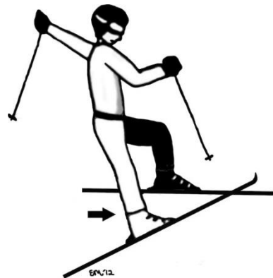
Slika 4. Mehanizam ozljeda uzrokovan skijaškim čizmama

Mehanizam ozljeda čemu su uzrok skijaške cipele je uglavnom uvijek jednak zbog deceleracije i promjene smjera kretanja. Nakon što skijaš izgubi kontakt s tlom s obje skije, što se događa pri skokovima ili poskocima, stražnji dio skija je obično prvi dio koji ponovno dođe u kontakt sa snijegom. To dovodi do iznenadnog pomaka tijela prema nazad dok su noge privezane za skije. Nakon što se završi slijetanje, vrhovi skija se spuste što na stražnji dio skijaške cipele vrši silu koja se prenosi dalje na tibijsku kost. Anteriorno usmjerena sila na tibijsku kost preko skijaških cipela dodatno je naglašena silom kvadricepsa i povlačenjem proksimalne tibije naprijed što je refleksna mišićna posljedica kojom se nastoji održati ravnoteža. Na taj se način stvara lančana reakcija pri kojoj se gornji dio tijela kreće prema natrag dok su donji ekstremiteti usmjereni prema naprijed stvarajući tako situaciju u kojoj se prednji križni ligament može izolirano ozlijediti. S obzirom da tu generalno nema valgus sile, medijalne i lateralne strukture koljena obično ostaju neoštećene osim ako nije uključena dodatna sila ili se dogodi pad (35).