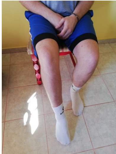
Slika 7. ispisivanje abecede u sjedećem položaju na stolici

Osoba se nalazi u sjedećoj poziciji na stolici i zadaje mu se zadatak da piše abecedu pomoću prstiju po podu. Ova će vježba izazavati zamor i dobru aktivaciju mišića gležanjskog zgloba, a isto tako je dobra vježba za razvoj kontrole i osjećaj položaja stopala u prostoru. Potrebno je 2-3 puta ispisati abecedu s mogućim varijancama velikih i malih slova (slika 7.).