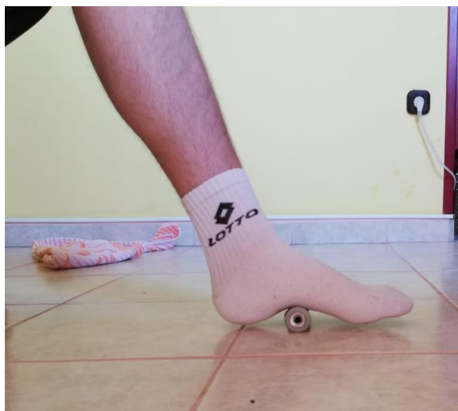
Slika 13. rolanje donjeg dijela stopala

Vježba valjanja donjeg dijela stopala. Vježba se provodi na način da se sportaš nalazi u sjedećem ili stojećem položaju, a na podu ispred se nalazi valjkasti objekt ili igličasta loptica. Sportaš stavi stopalo na valjkasti objekt ili na lopticu te laganim pokretima stopala prema naprijed i prema natrag inervira donji dio stopala. Ova vježba se pokazala korisnom u svrhu razvoja propriocepcije i razvoj osjećaja u stopalu. Vježbu treba provoditi 30-40 sekundi naizmjenično jedna pa druga noga po 2-3 serije 2-3 puta dnevno (slika 13.).