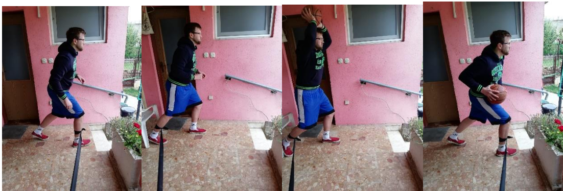
Slika 24. narušavanje stabilnosti pomoću gumene trake

U ovoj vježbi sportašu će biti potrebna pomoć trenera. Sportaš se nalazi u uspravnom položaju s loptom i zavezanom elastičnom trakom oko jedne noge. Trener stoji s bočne strane sportaša te je zadužen da prilikom iskoraka sportaša, povlači rastezljivu traku u različitim smjerovima i različitim intenzitetima. Prilikom iskoraka sportašu je dozvoljeno ili vođenje lopte ili sakrivanje lopte od zamišljenog protivnika. Sportaš iskoračuje naprijed, natrag ili u stranu. Potrebno je vježbu provoditi za početak 30 sekundi do jedne minute intenzivno, nakon čega slijedi pauza od 30 sekundi. Potrebno je vježbu ponoviti u 3 serije te dodatno otežavati kako osoba napreduje. Vježba pomaže sportašu da stvori reakciju na ne predvidive sile koje mogu na vanjski način utjecati na tijelo sportaša (slika 24.).