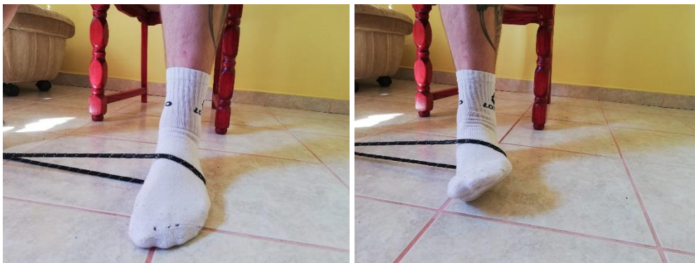
Slika 9. i 10. everzija stopala uz pomoć rastezljive trake

Ova je vježba slična prošloj vježbi samo što neće biti prisutna izometrička kontrakcija, a umjesto zida će se koristiti rastezljiva traka. Sportaš u sjedećem položaju omota traku oko članaka nožnih prstiju i izvodi koncentričnu kontrakciju u inverziji i u everziji u obje varijante. Potrebno je napraviti 10-15 ponavljanja, 2-3 serije, 2-3 puta dnevno (slika 9. i 10.).