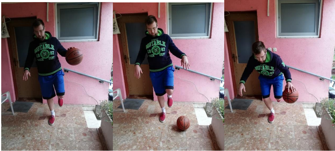
Slika 23. vođenje lopte na jednoj nozi u različitim pozicijama

Potrebno je odraditi barem dvije minute efektivnog vođenja lopte i po dvije do tri serije. Pauza od 20 sekundi između serija (slika 23.).