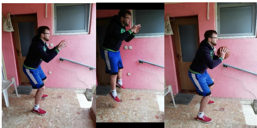
Slika 22. hvatanje lopte u skoku iz obrambenog košarkaškog stava

Sportaš se nalazi u obrambenom košarkaškom stavu bez lopte. Na znak trenera sportaš sunožno skače prema naprijed i prima loptu koju mu dodaje trener. Ovu vježbu je moguće kasnije dodatno zakomplicirati na način da se sportaš odražava s jedne noge, a prilikom doskoka isto tako je moguć doskok na jednu nogu ili na obje noge što je za početak sigurnija solucija. Potrebno je odraditi 10 skokova u 2-3 serije (slika 22.).