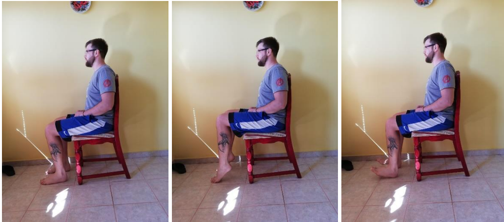
Slika 2., 3. i 4. Podizanje pete i prstiju u sjedećoj poziciji

Sportaš se nalazi u sjedećem položaju na stolici. Vježba se sastoji od jednostavnog podizanja pete s time da su prsti u stalnom kontaktu s podom. Vježbe se može isto tako odrađivati na način da se prsti podižu, a pete su u konstantnom kontaktu s podom. Faza podizanja se treba zadržati 1 sekundu, pokreti moraju biti polagani i kontrolirani. Potrebno je napraviti 10-15 ponavljanja u 2-3 serije 2-3 puta dnevno (slike 2. – 4.).