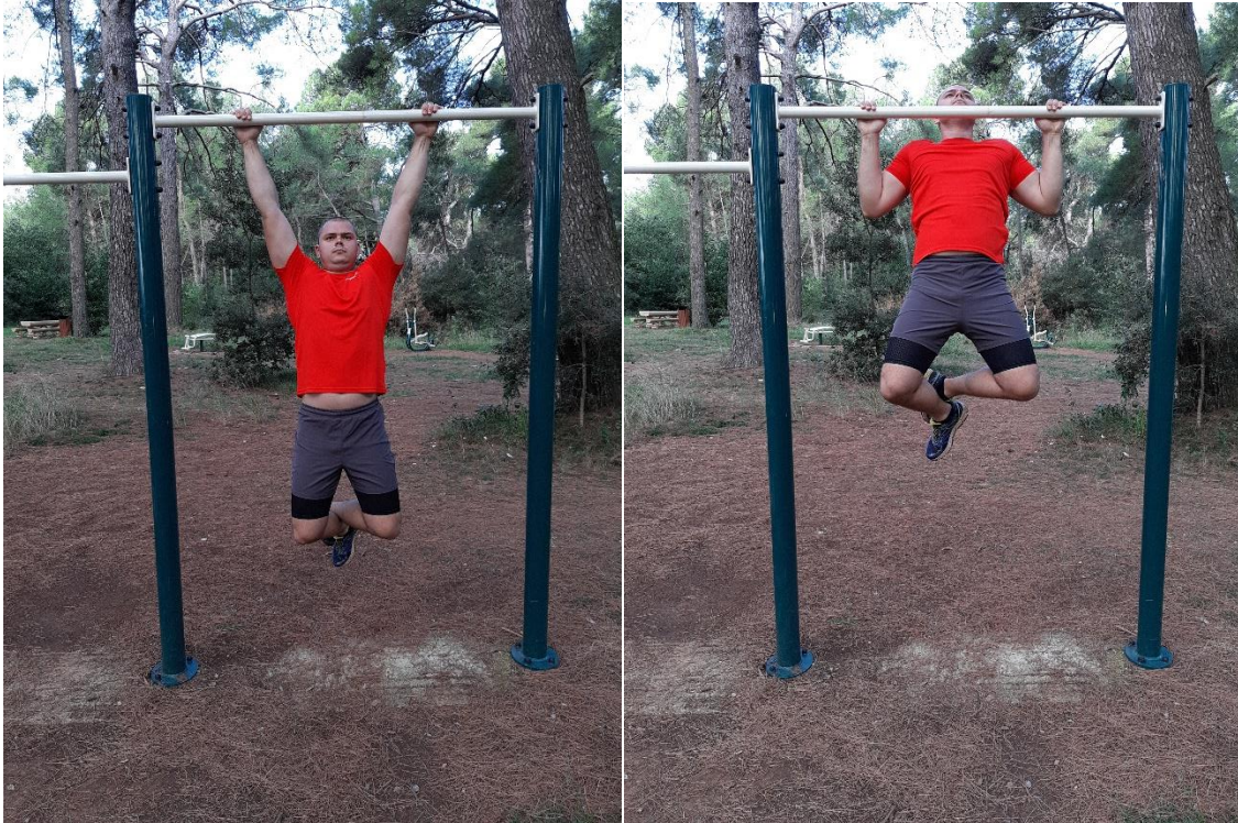
Slika 5: Zgibovi (Pull Ups)