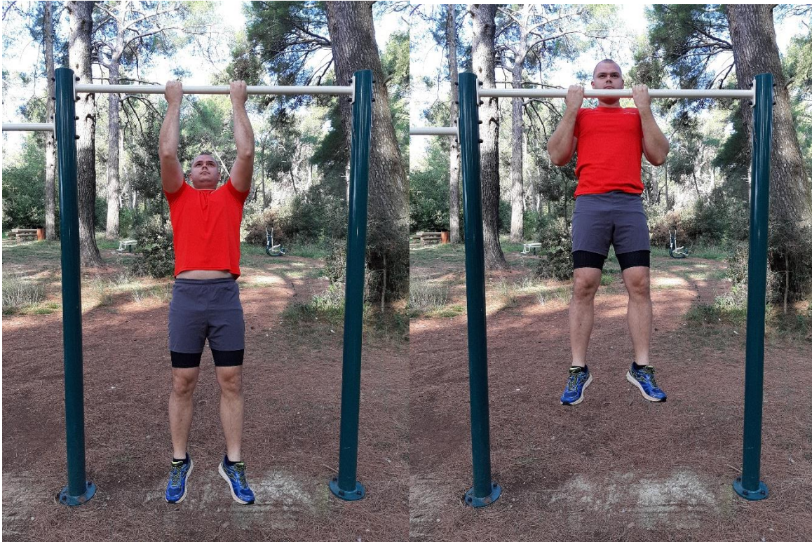
Slika 6: Kontra Zgibovi (Chin Ups)