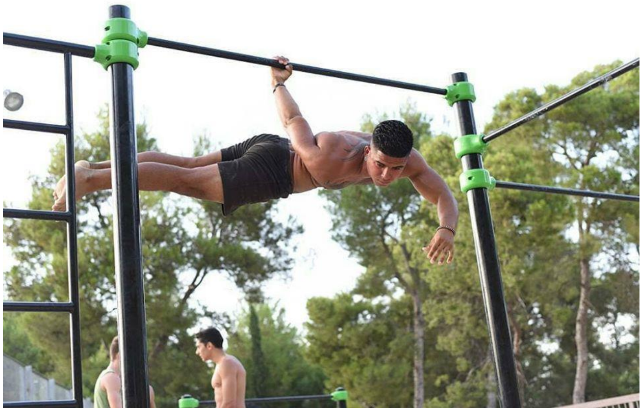
Slika 18: Back lever na jednoj ruci, close to impossible ( Facebook, 2018 ).