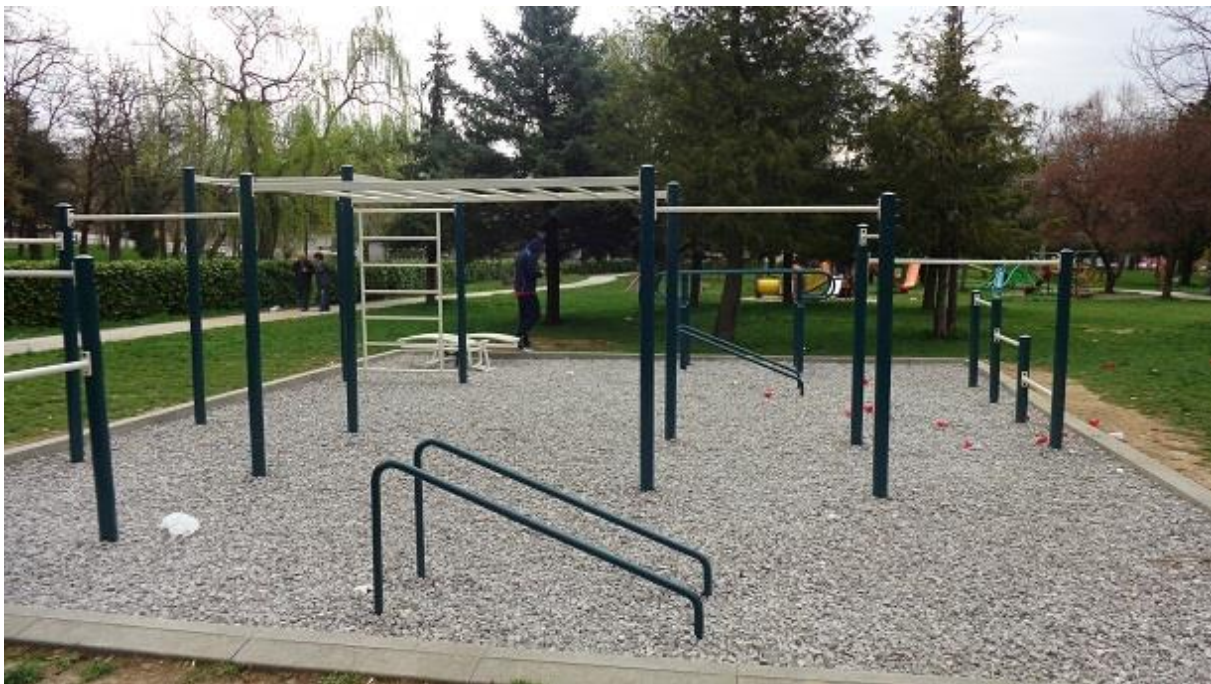
Slika 13: Street workout trening park