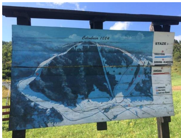
Slika 5. Mapa skijališta

za proizvodnju umjetnog snijega kako bi skijalište što dulje u zimskim mjesecima bilo u funkciji.