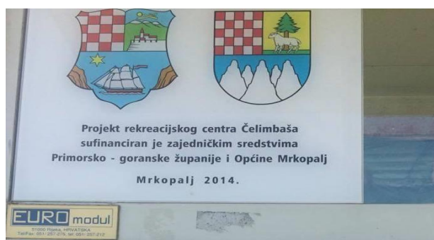
Slika 8. Natpis načina financiranja skijališta

U razgovoru s nadležnima, skijalište je prethodnu zimu bilo u funkciji pet dana što je jako tužno za jedan skijaški centar i cijeli Gorski kotar. Riječ je o “slabim” zimama, pretopla klima, južni vjetar i kao posljedica svega dolazi do brzog topljenja snijega. S obzirom na skoro nikakva ili mala ulaganja zbog lošeg financijskog stanja, skijalište iz godine u godinu sve više propada, nemogućnost kupnje snježnih topova i nezainteresiranost same države oko ovakvih investicija ne dovodi do pozitivnih rezultata.