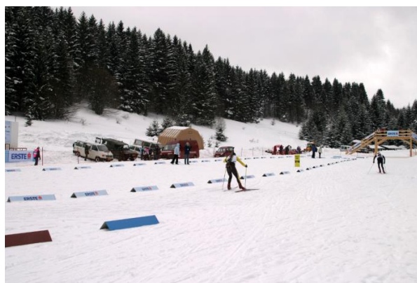
Slika 13. Biatlon centar Zagemajna